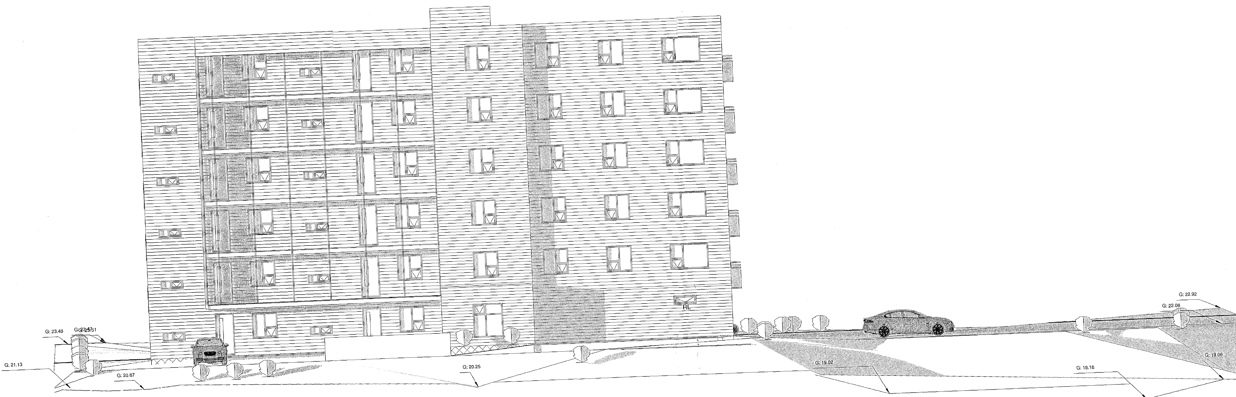
2 Norður 1 : 100