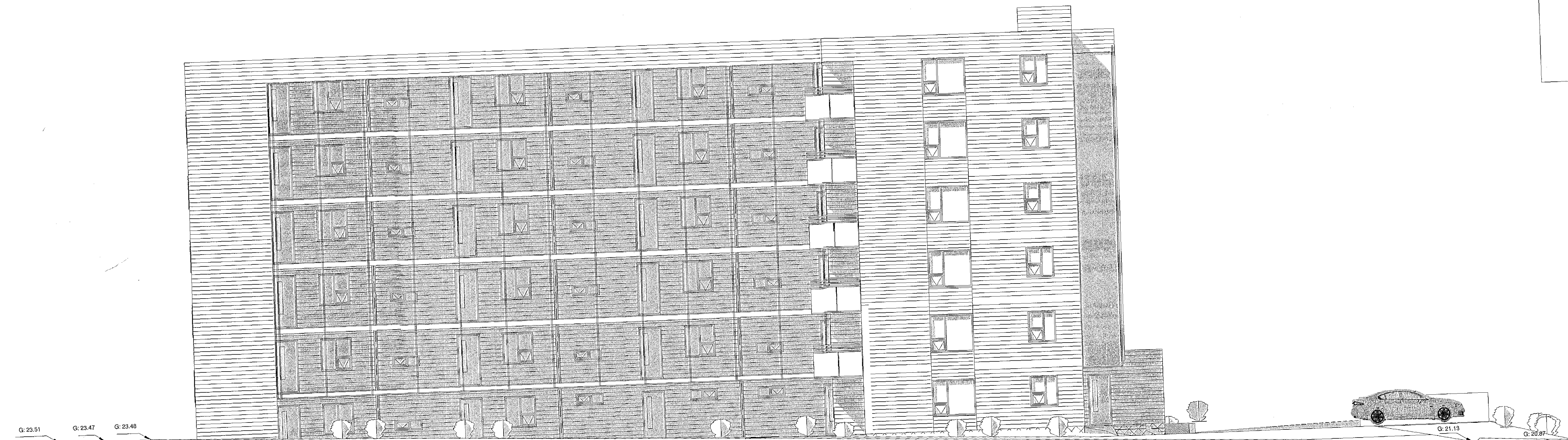
1 Austur 1 : 100