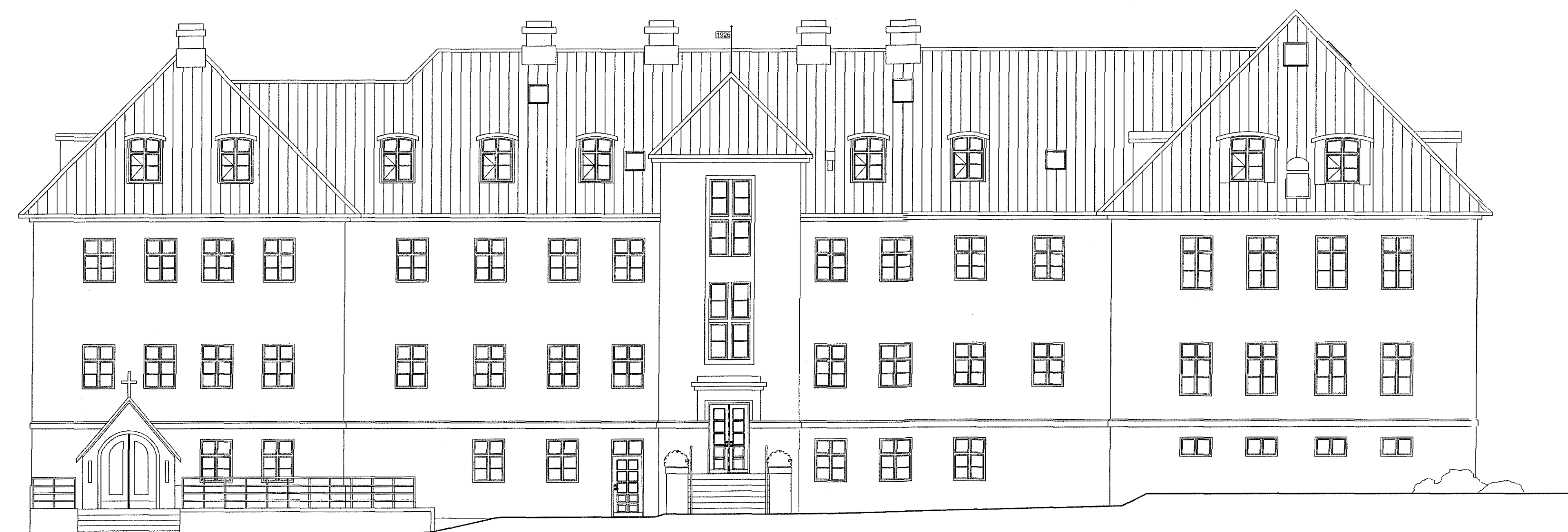
ÚTLIT VESTUR MKV 1:100