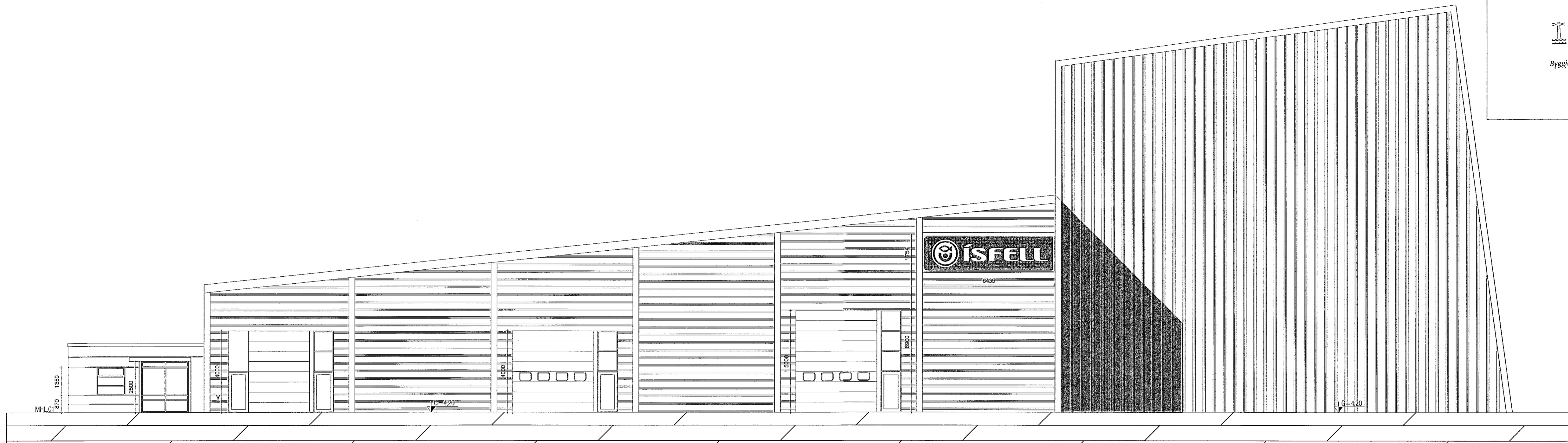
Útlit suður mkv 1:100