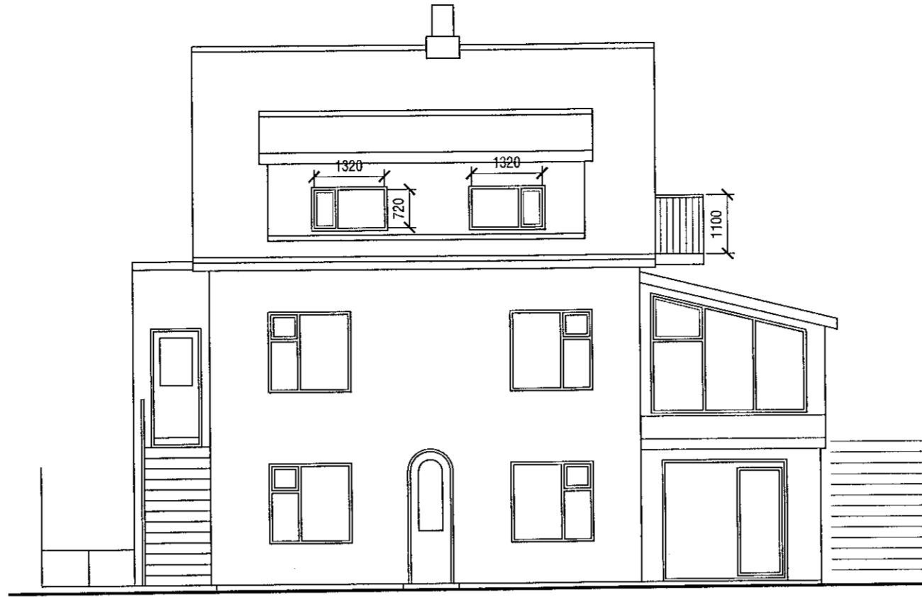
Ásýnd - Suð-vestur mkv. 1:100