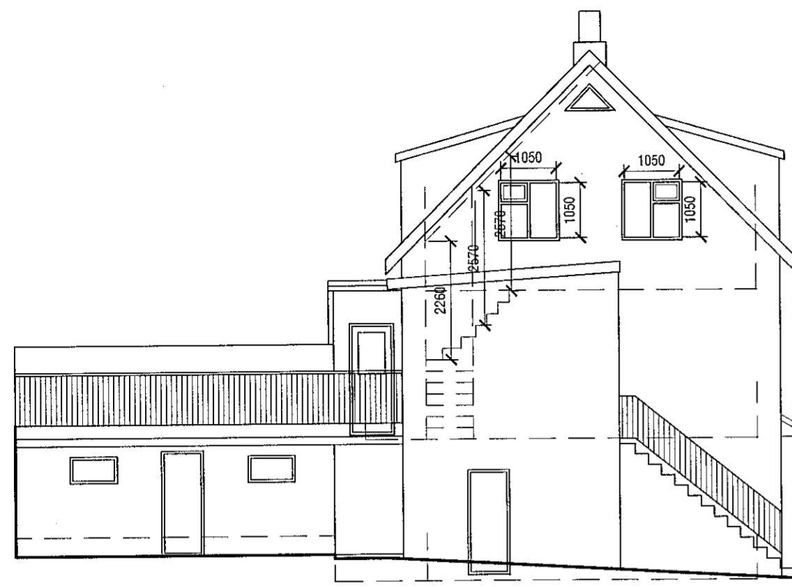
Ásýnd - Norð-vestur mkv. 1:100

Byggingarfulltrúinn í Hafnarfirði Hildur Árnadóttir