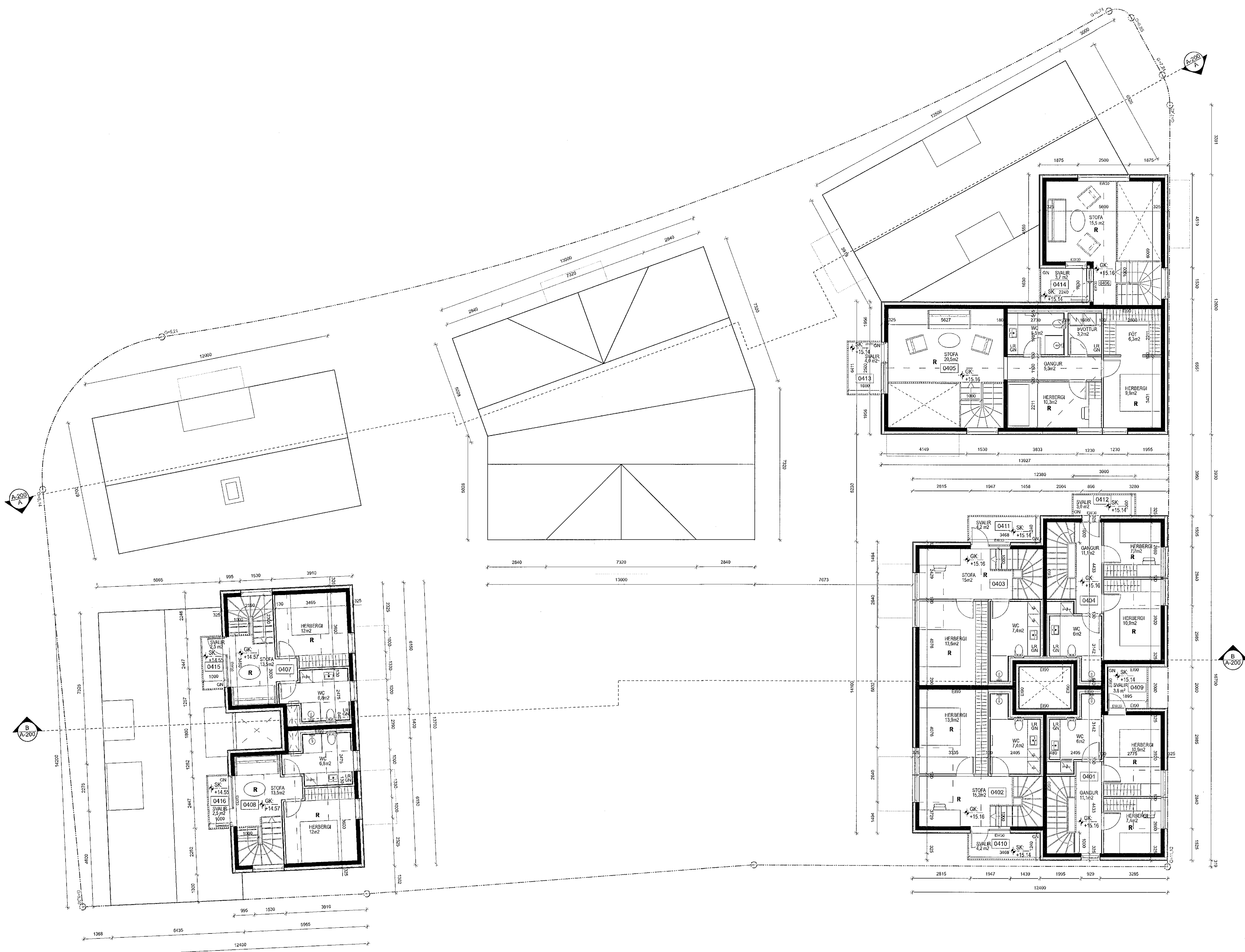
1 GRUNNMYND +4 Skali: 1:100