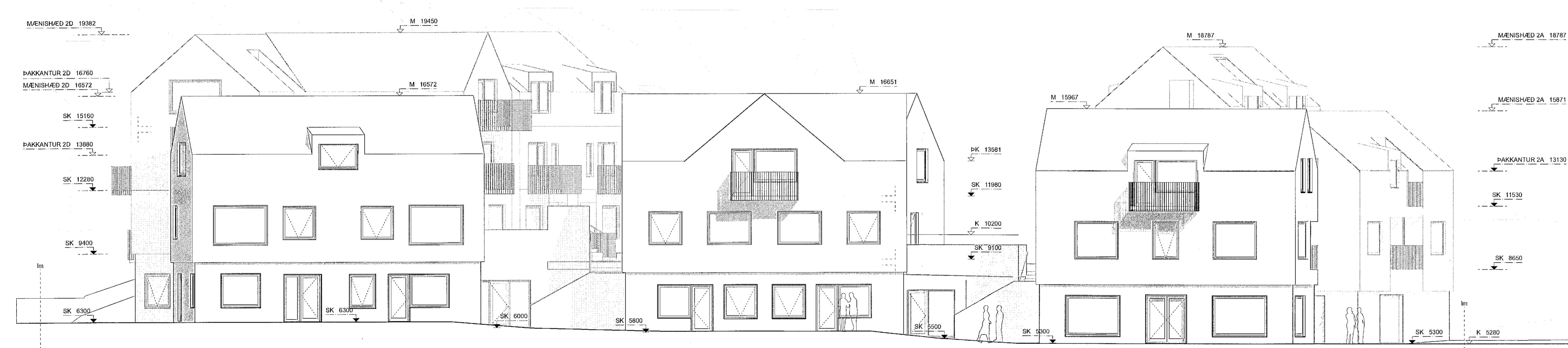
2 ÁSÝND NORÐUR - LÆKJARGATA Skali: 1:100