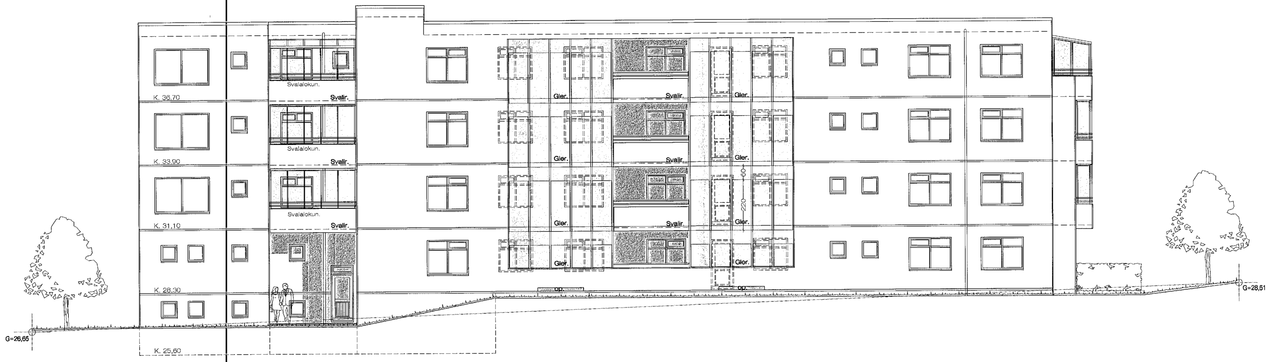
Norðurhlið 1 : 100

Samþykkt þann 26. MAÍ 2021 Byggingarfulltrúinn í Hafnarfirði Sildur Þórnadóttir