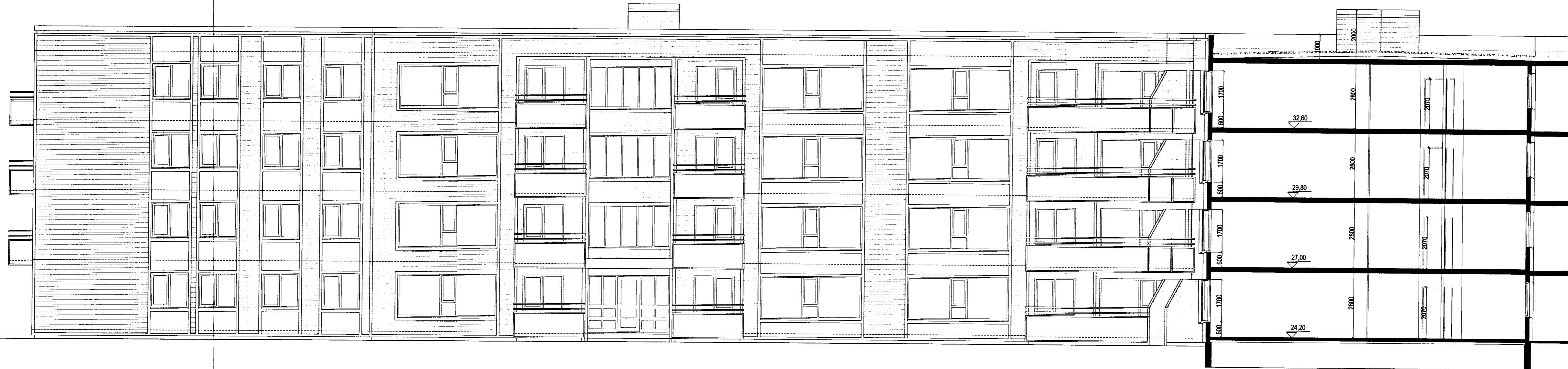
SUÐUR-ÚTLIT NORÐURÁLMO. MKV. 1:100.