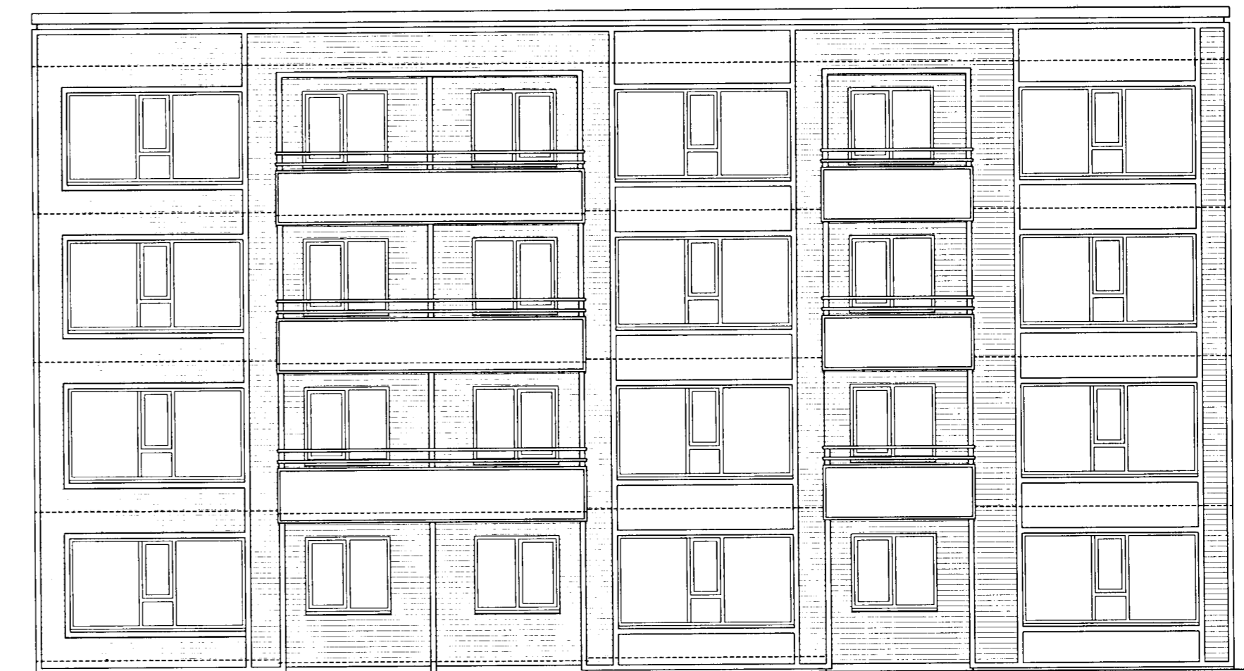
VESTUR-ÚTLIT NORÐURÁLMO. MKV. 1:100.

BURKNAVELLIR 17A - 17B OG 17C HAFNARFIRÐI.