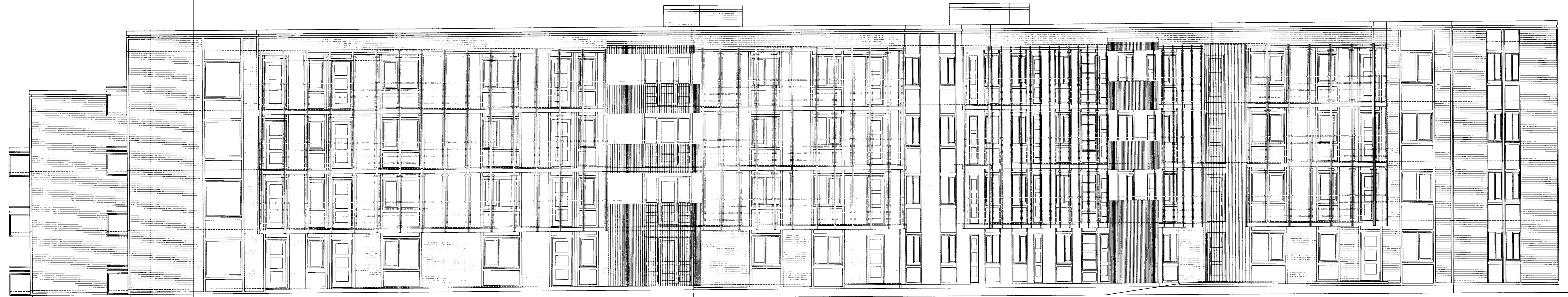
ÚTLIT AUSTJR. MKV. 1:100.