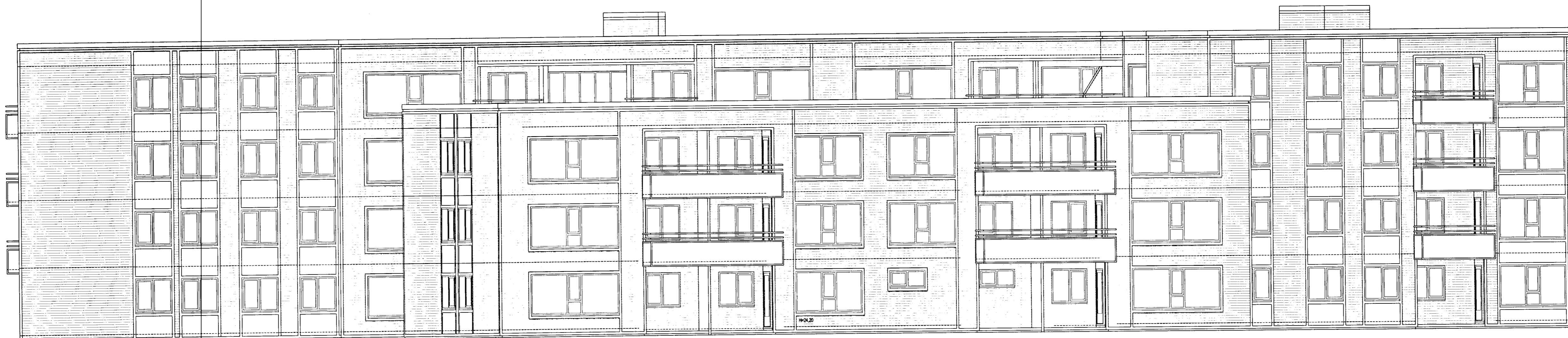
ÚTLIT SUÐUR. MKV. 1:100.