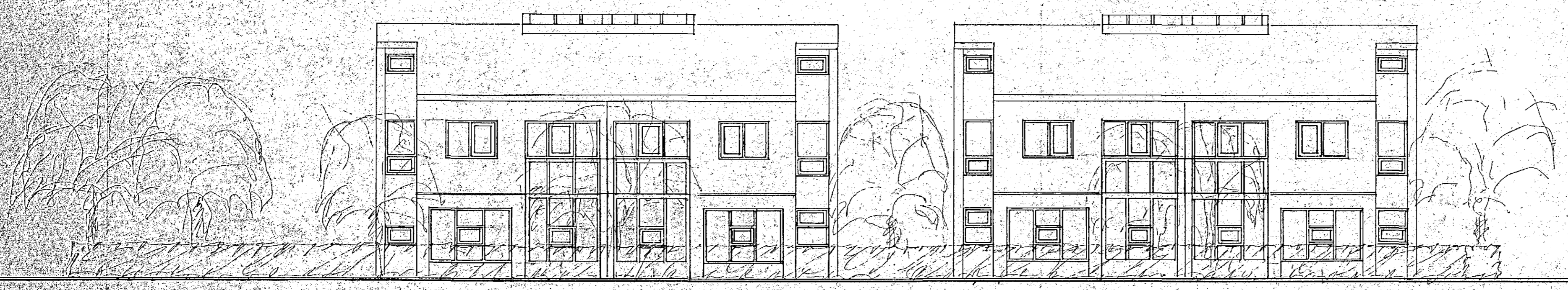
austur (að garði) nr. 60 nr. 62 nr. 64 nr. 66

S T U D L A B E R G 6 6 , 6 4 , 6 2 , 6 0 , H A F N A R F I R D I útlitsmyndir að götu og garði