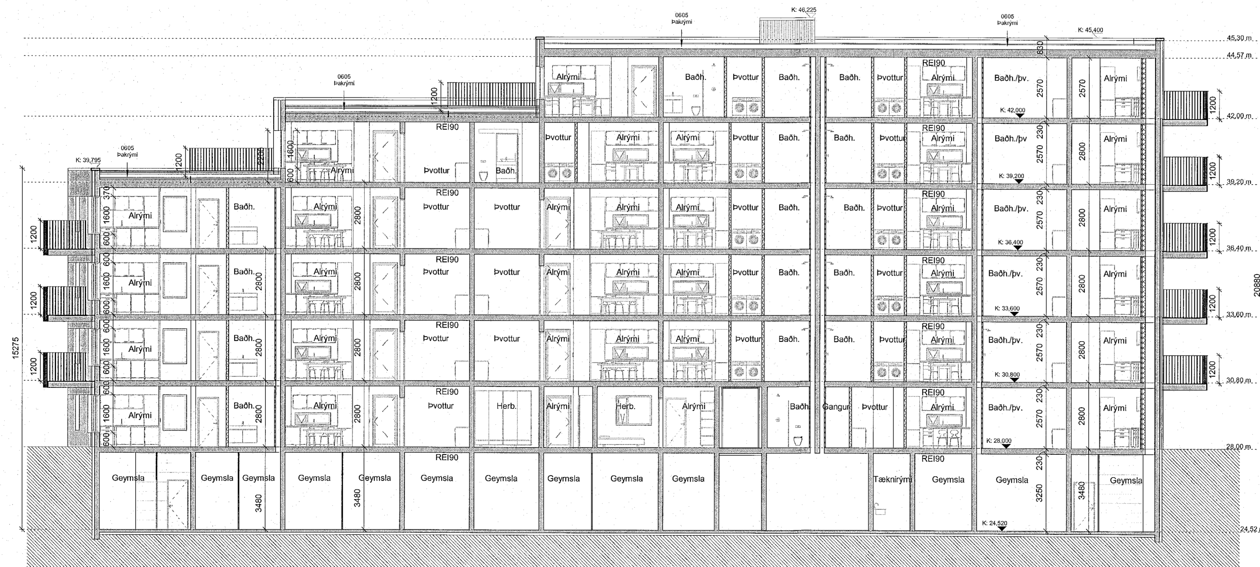
Sneiðing BB - Mhl. 02 1:100