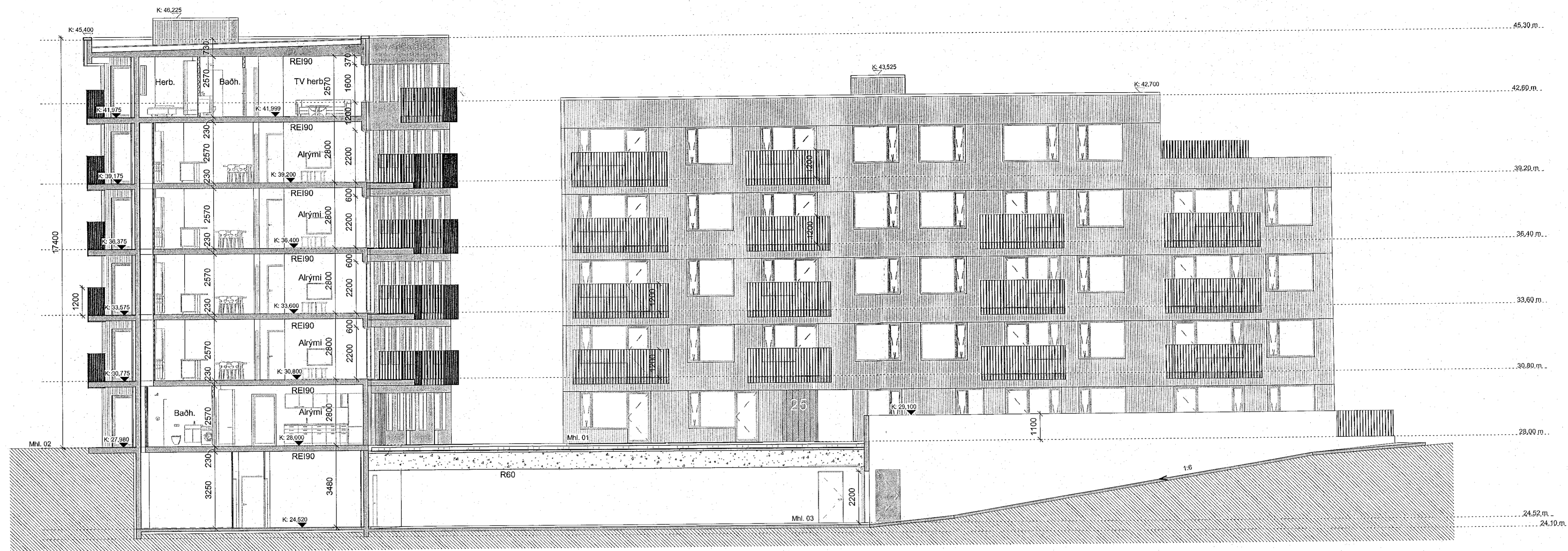
Sneiðing FF - Allir matshlutar 1:100

Öll mál takist/staðfæriss á staðnum áður en smíði hefst. Misræmi í teikningum skal tafarlaust tilkynna hönnuðum. Teikningar arkitekta skal lesa með teikningum meðhönnuða.