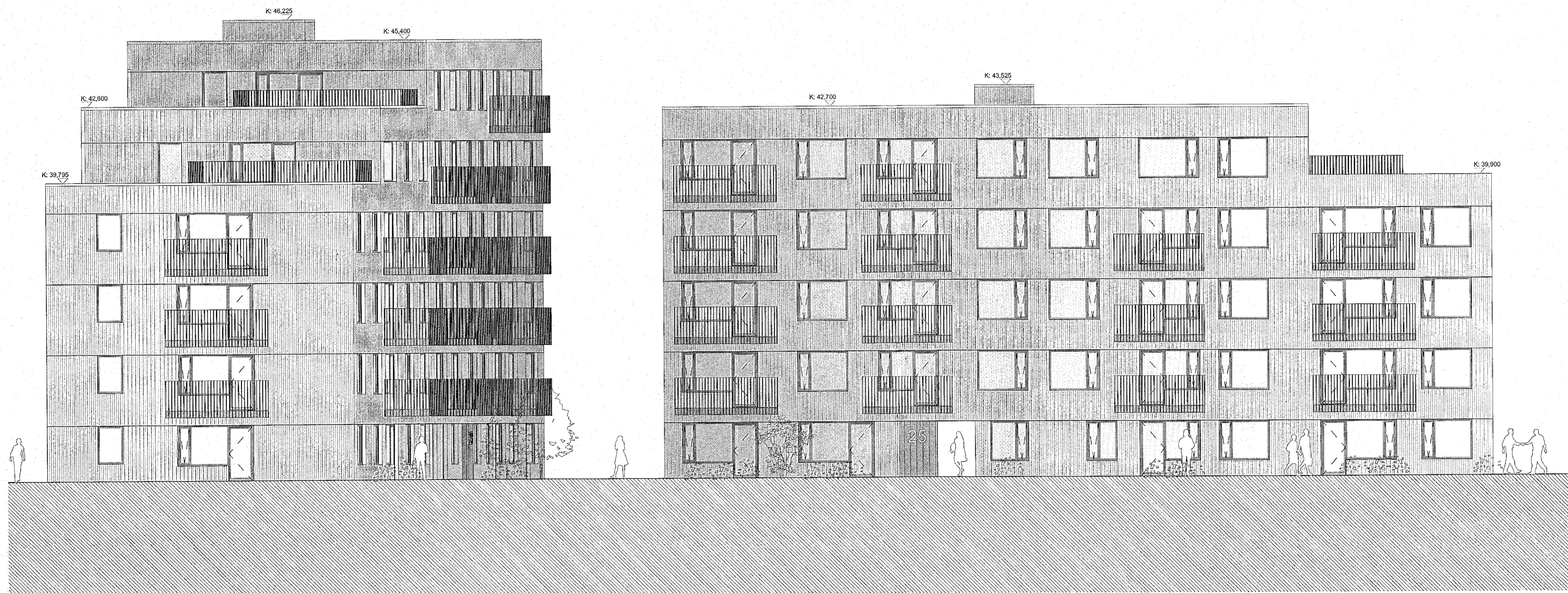
02-Suður - Mhl. 02 / Mhl. 01 1:100