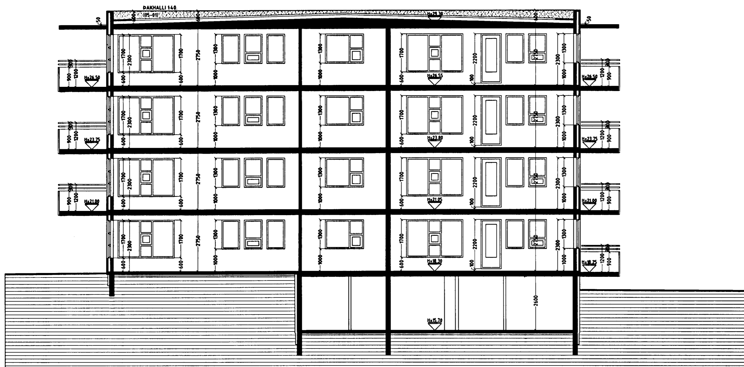
SNID D-D MKV. 1:100.

VARDANDI EINGAR Í HÚSI: Eingar skulu vottaðar sbr. ákvæði í byggingarreglugerð og skal yfirlýsing um það liggja fyrir hjá byggingartull-trúa áður en þær komu á byggingarstað. Hús með einingum án vottunar fá ekki fjárheldisvottorð.