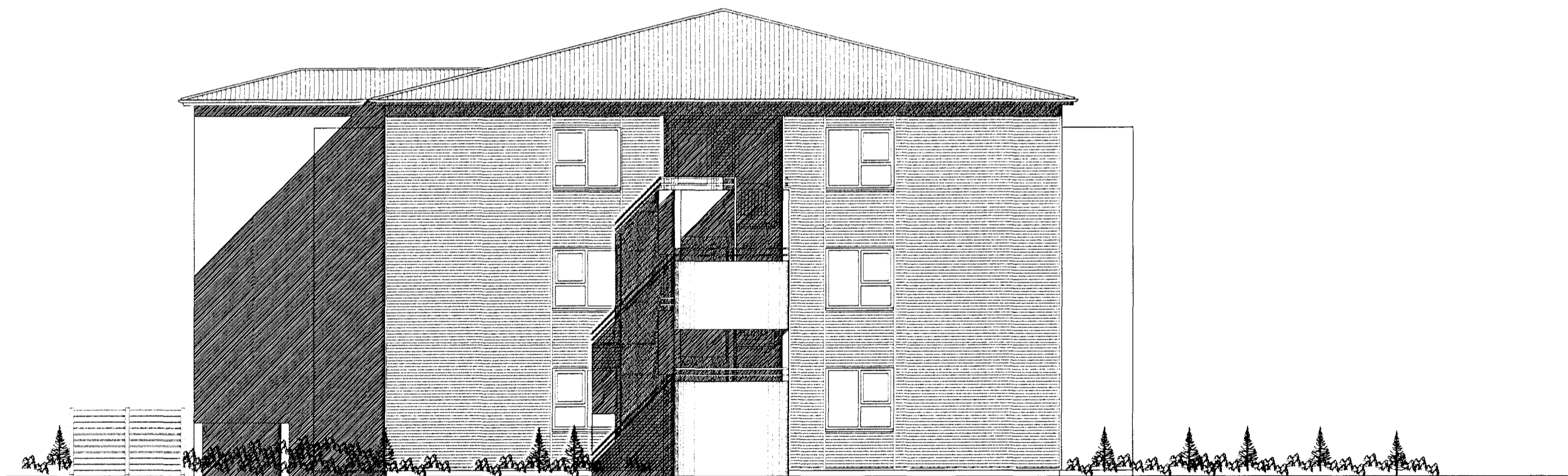
ÚTLIT NORÐUR MKV. 1:100.