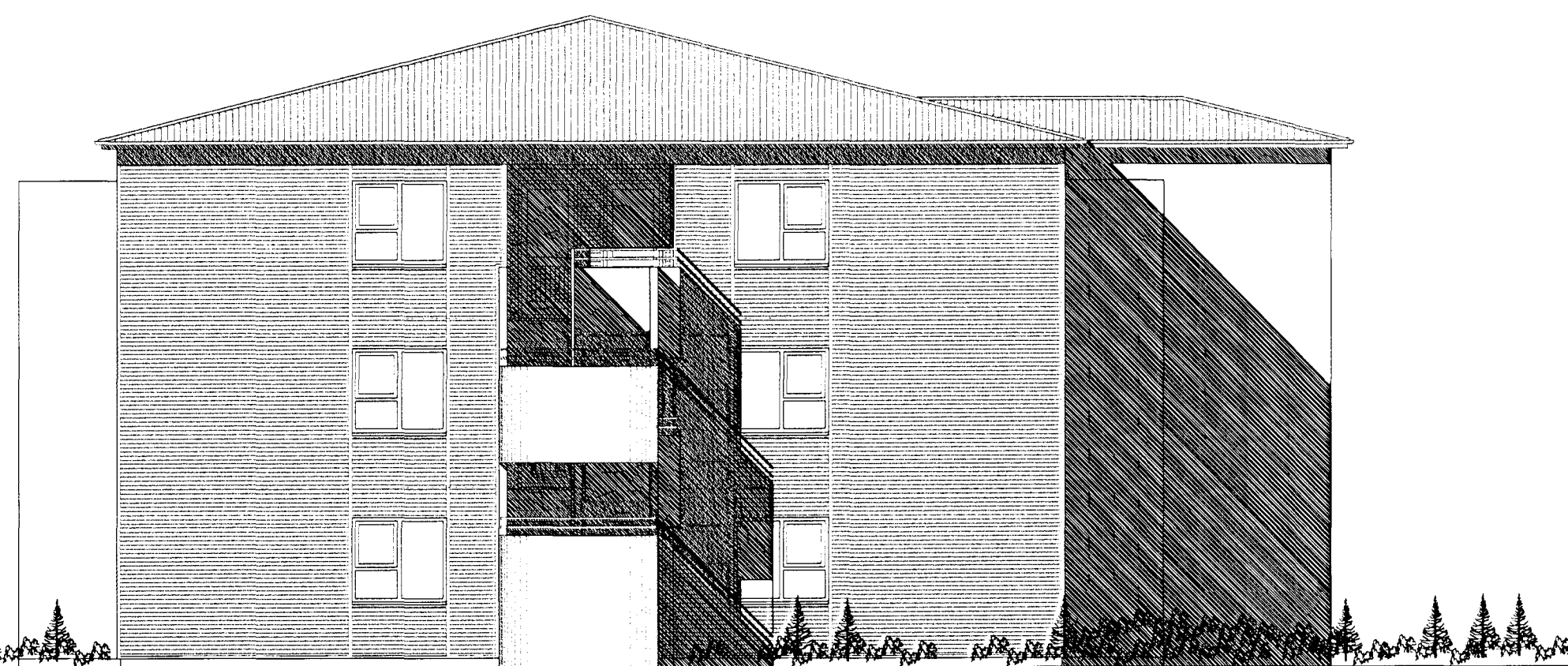
ÚTLIT SUÐUR MKV. 1:100.