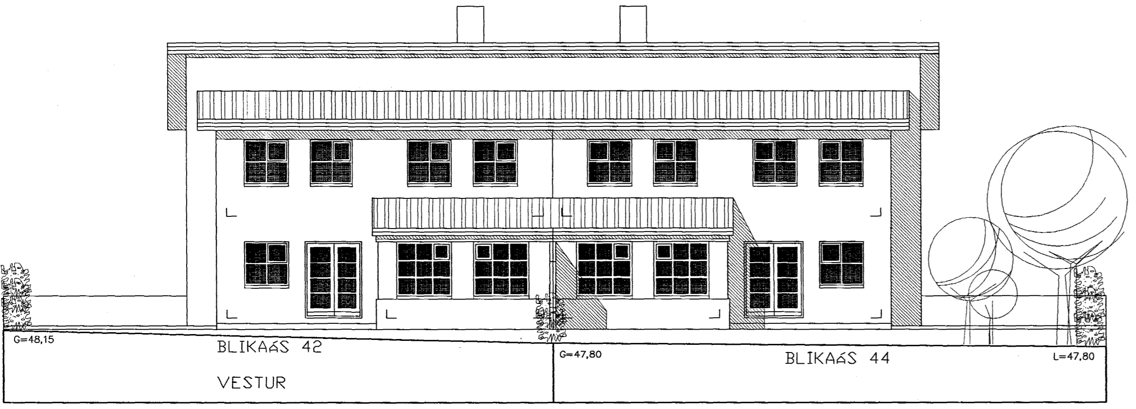
G=48,15 BLIKAÁS 42 VESTUR G=47,80 BLIKAÁS 44 L=47,80