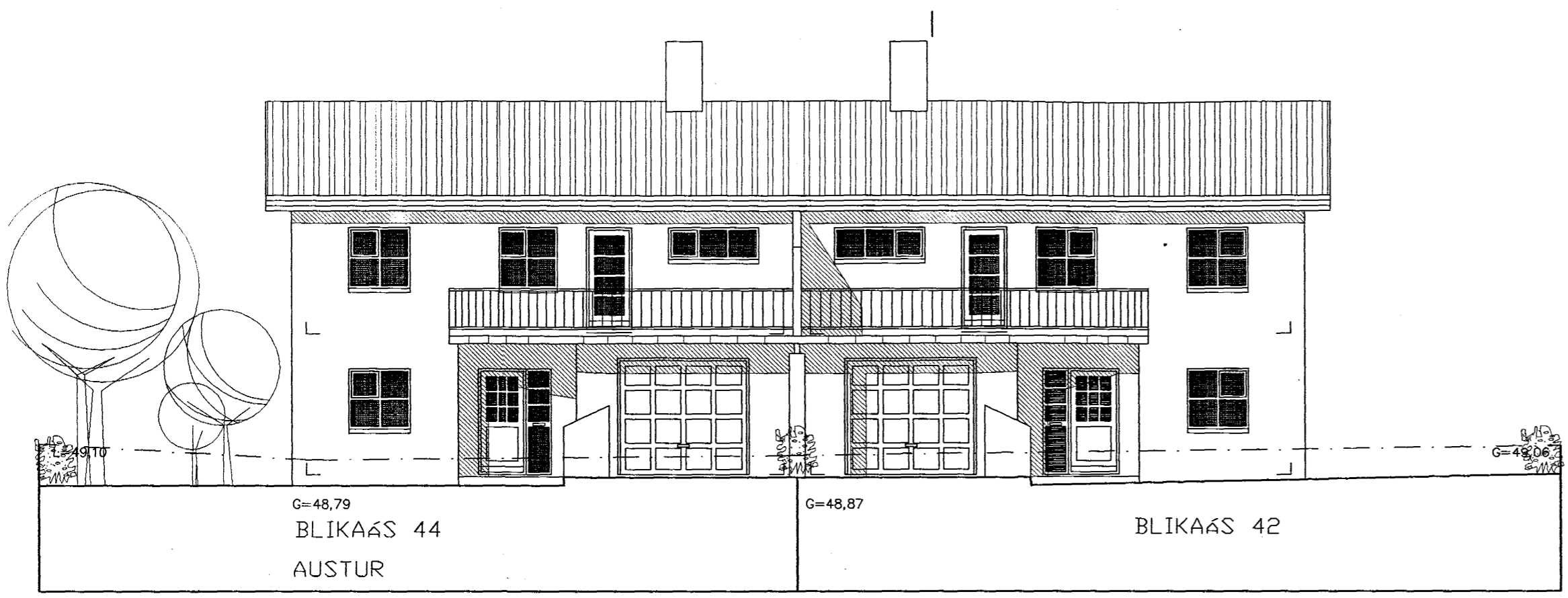
G=48,79 BLIKAÁS 44 AUSTUR G=48,87 BLIKAÁS 42