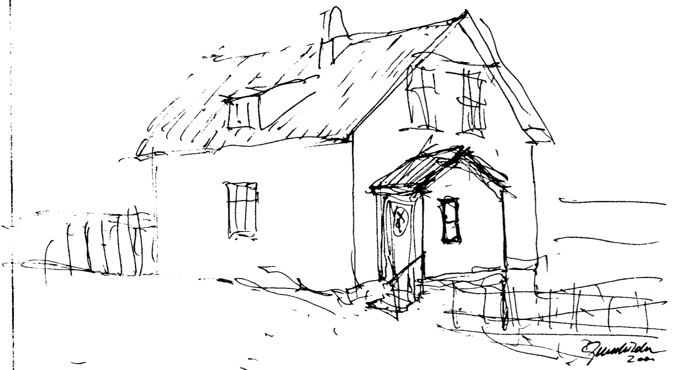
skissa af útliti viðbyggingar