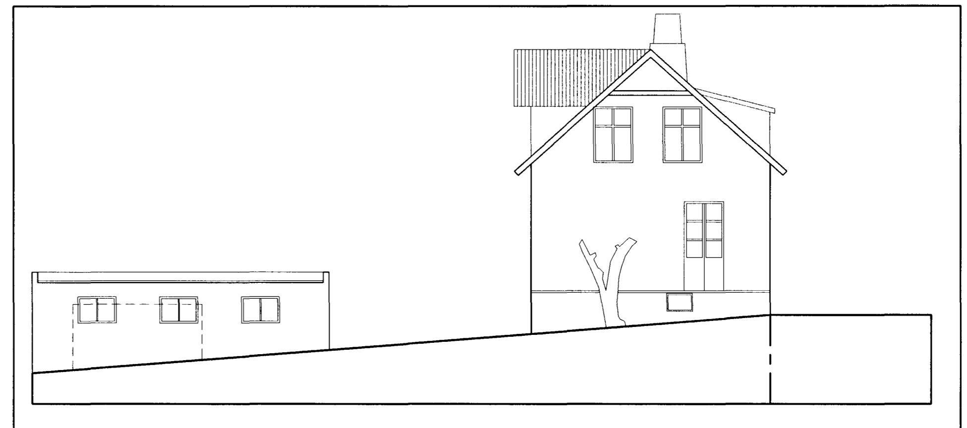
útlit til suðurs 1:100