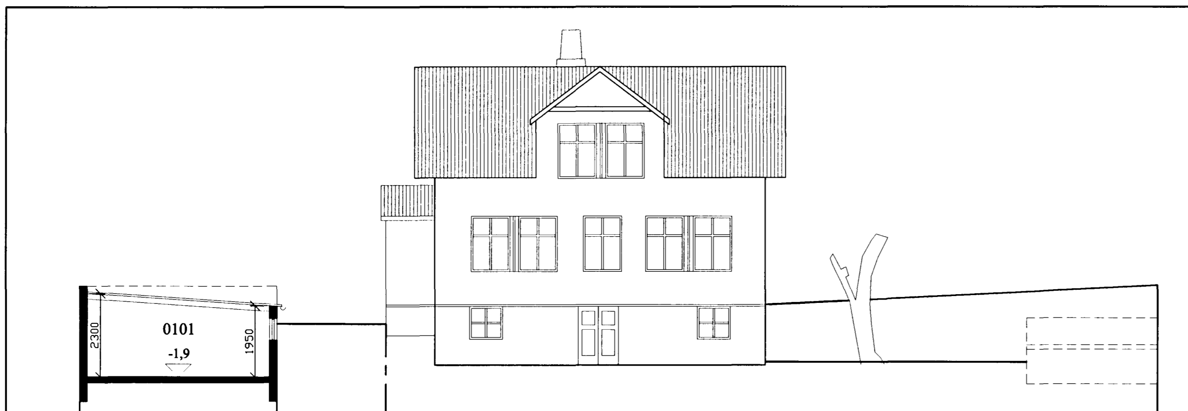
skurður c-c, útlit til vesturs 1:100

Breytingar: pallur við inngang stækkaður. 17.08.2000