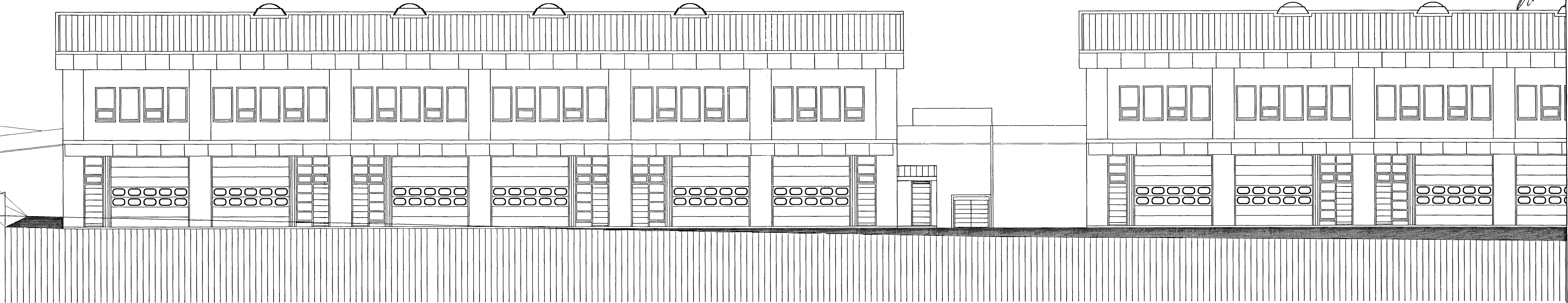
NORÐUR. MKV. 1:100.

Samþykkt Samþykkt þann 06 MARS 2002 Byggingafræðingur í Hafnarfirði F.h. Kristján Þorarinsson Kristján Þorarinsson