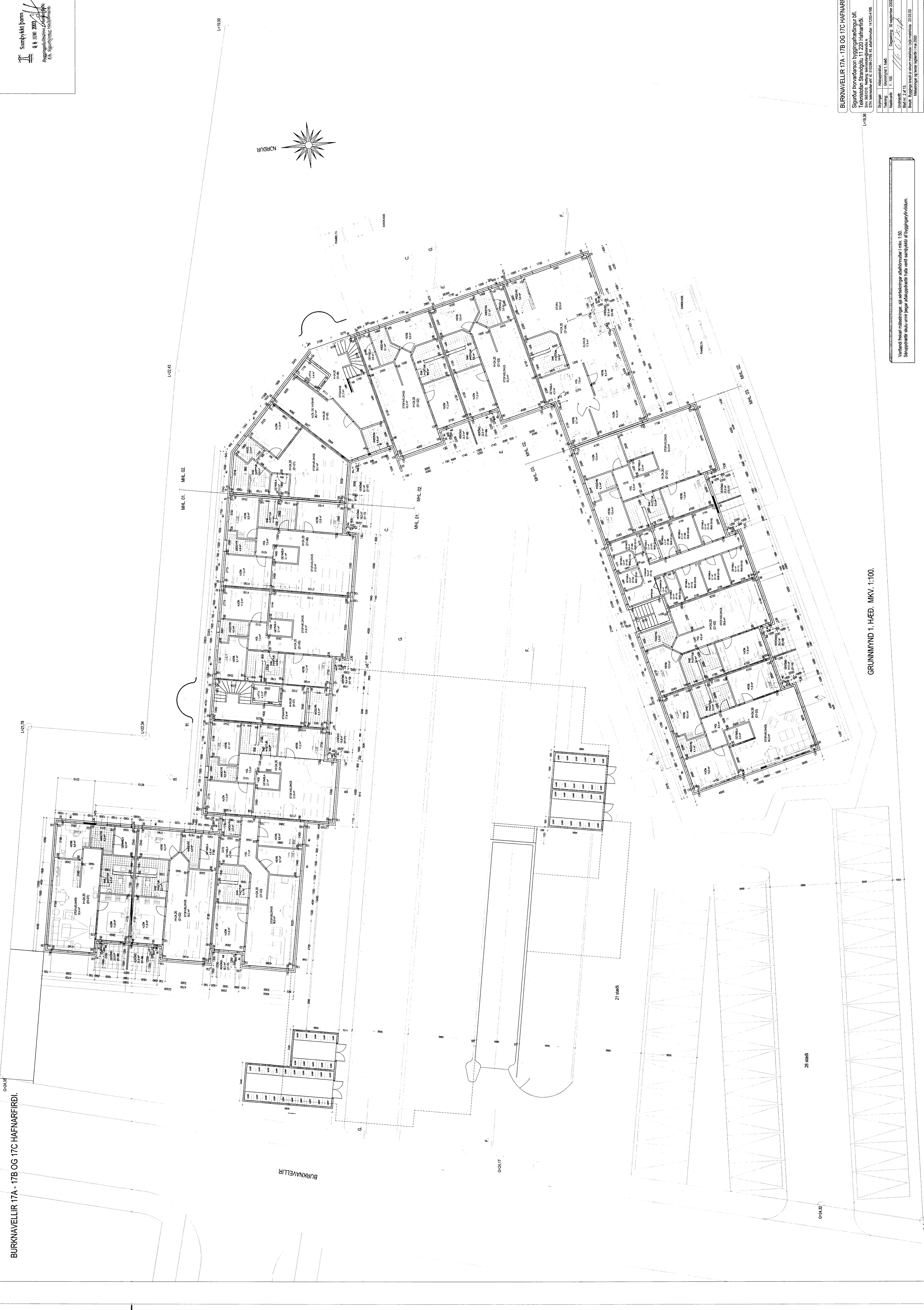
GRUNNMYND 1. HÆÐ. MKV. 1:100.

BURKNAVELLIR 17A - 17B OG 17C HAFNARFIRÐI Spurður Þorsteinnsson byggingarfræðingur hf. Télinnstráen Strandgötu 11 220 Hafnarfirði. Sími 565 6151. Netfang: hst@stt.is STH skránum nr. E 51038-2008. At. skránum nr. 11252-1189. Stjórnun: Arkitektúr. Teikning: Grunnmynd 1. HÆÐ. Mækkvæði: 1:100. Dagsetning: 20. September 2009. Bláddráttur: 4.13. Bygging: Byggingarfræðingur hf. er umráðslaus og tekur ábyrgð á byggingarfræðingnum. Máláttun og teikningur frá 2009.