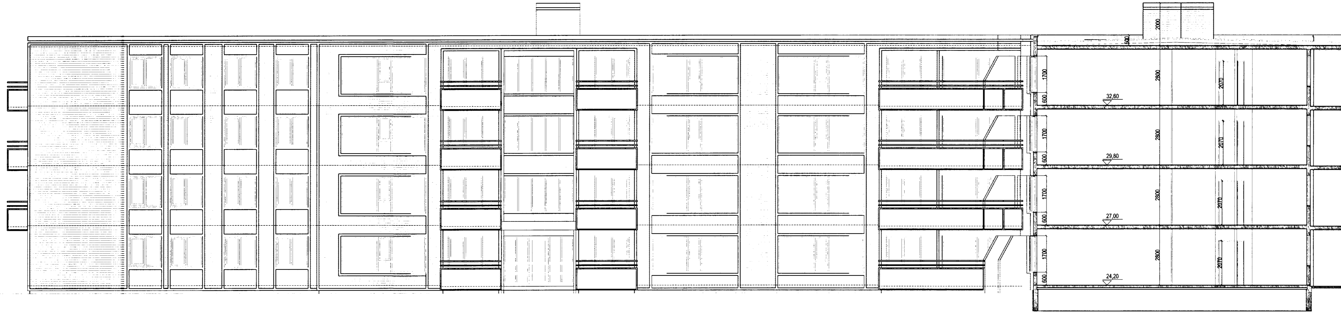
SUÐUR-ÚTLIT NORÐRÁLMU. MKV. 1:100.