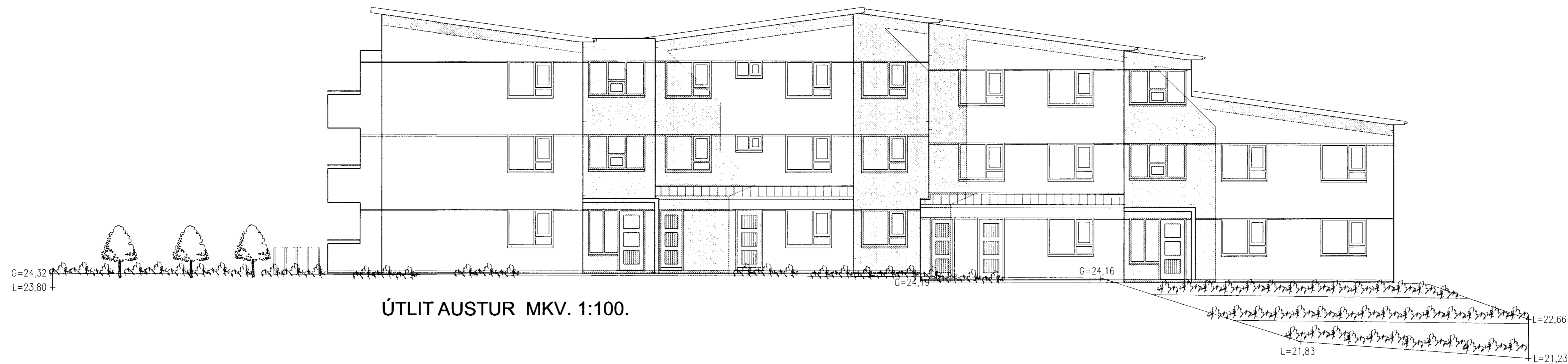
ÚTLIT AUSTUR MKV. 1:100.