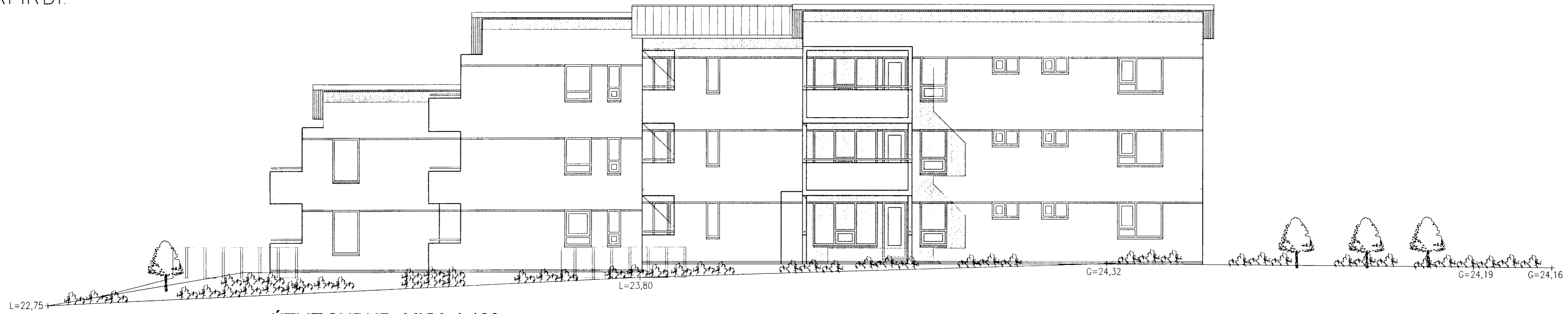
ÚTLIT SUÐUR MKV. 1:100.