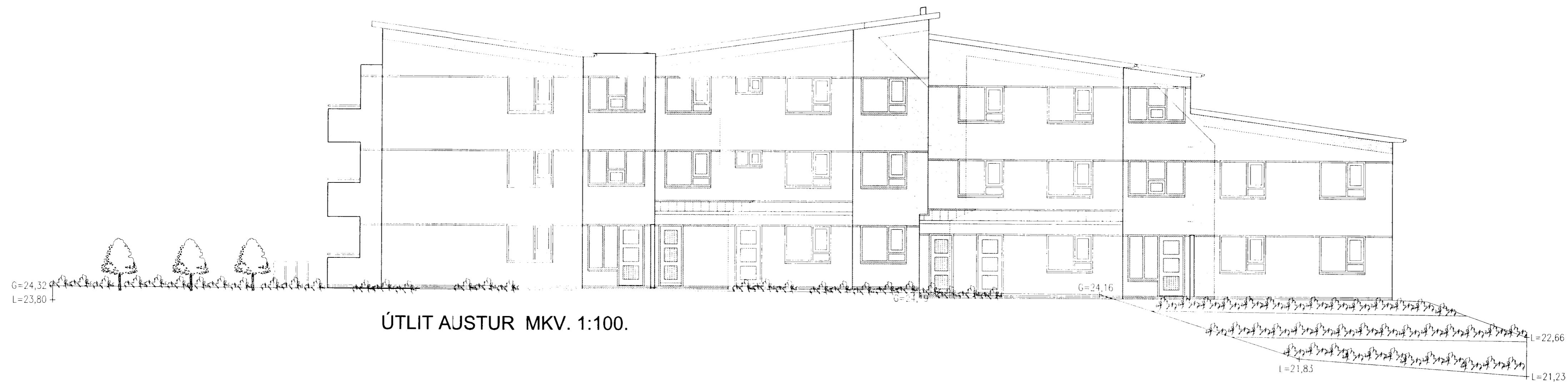
ÚTLIT AUSTUR MKV. 1:100.