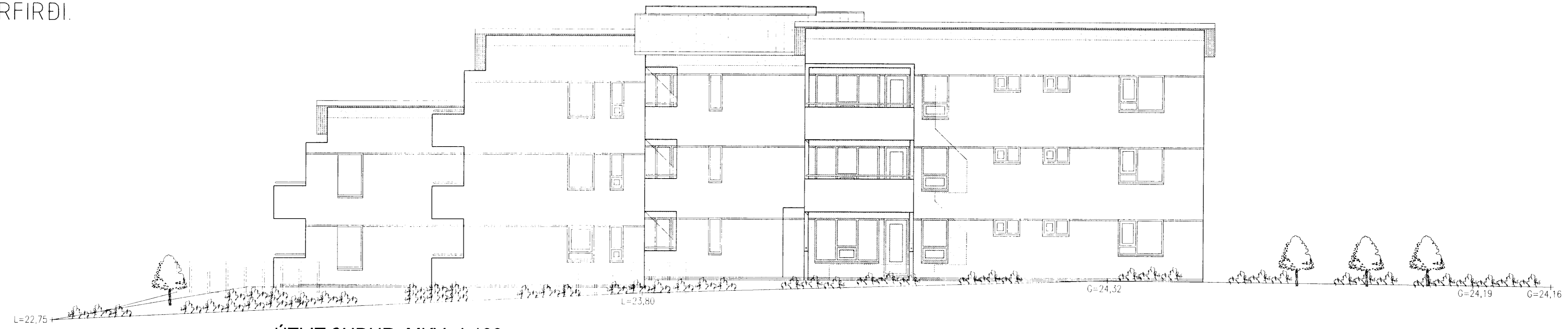
ÚTLIT SUÐUR MKV. 1:100.