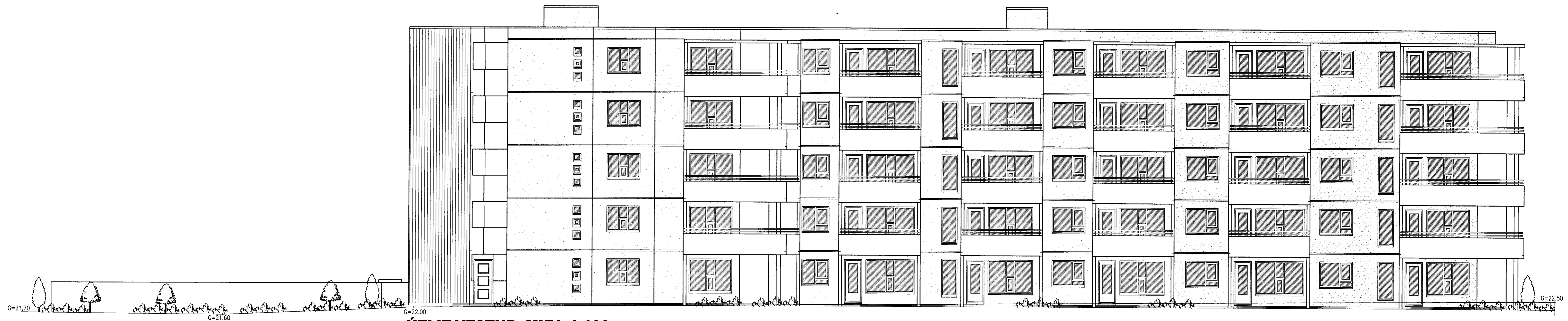
ÚTLIT VESTUR MKV. 1:100.