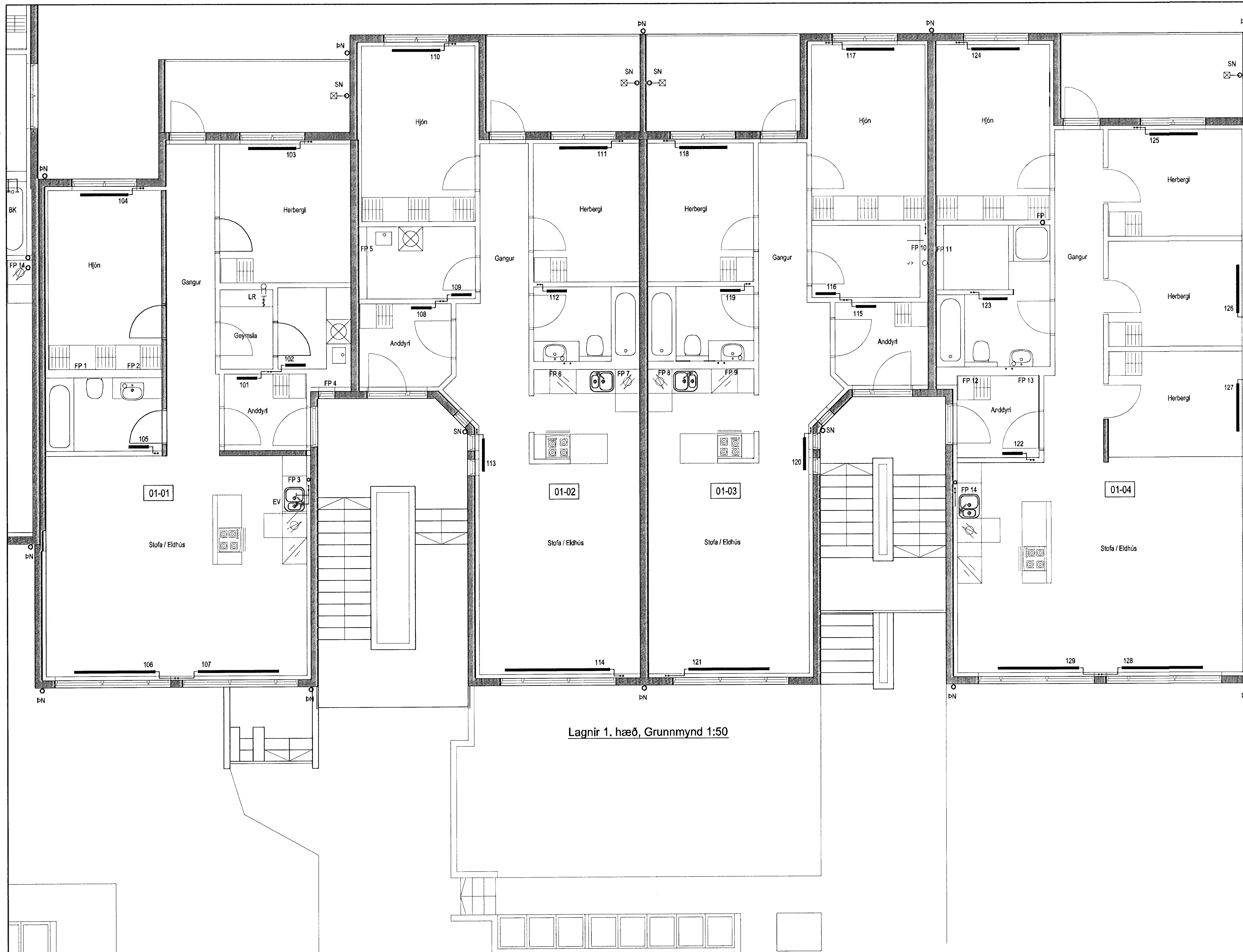
Lagnir 1. hæð, Grunnmynd 1:50

Samþykkt þann 28. Jún. 2013 Byggingafræðingur / Hafnarfirði F.h. Höfður S. Gunnlaugsson