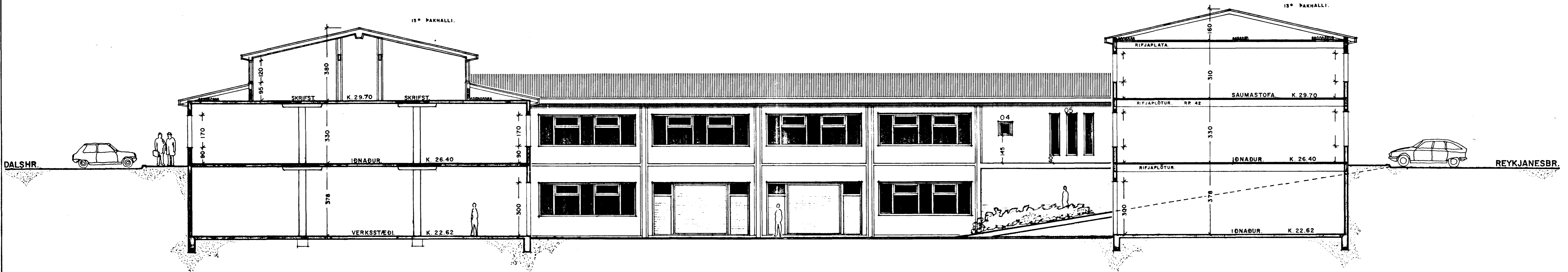
SKURÐUR. A - A