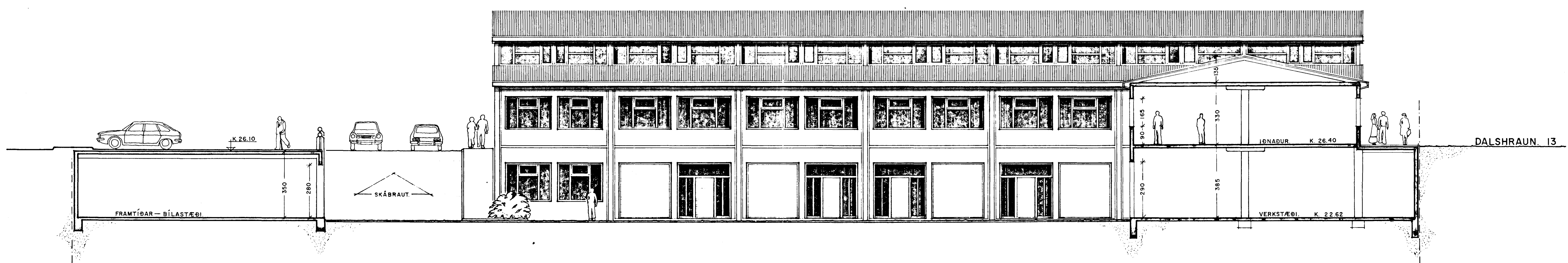
SKURÐUR. B - B

SAMÞYKKT 8/3 1983 SBR. BRÉF DAGS. 8/3 1983