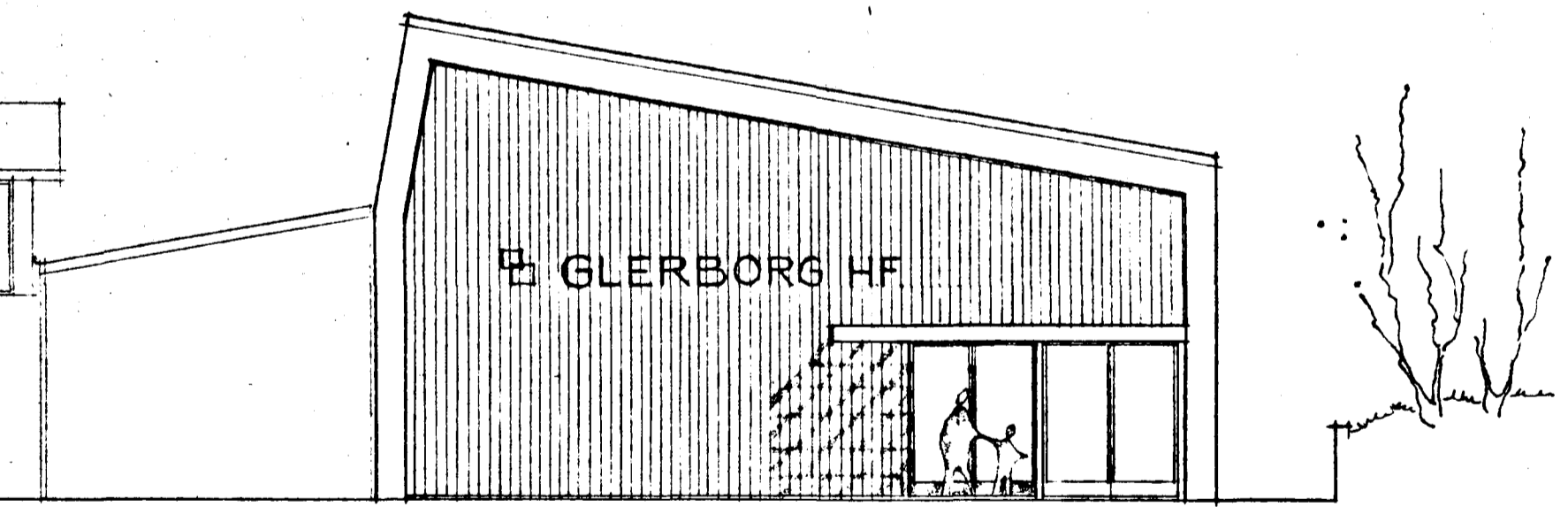
SUÐURGAFL M. 1/100