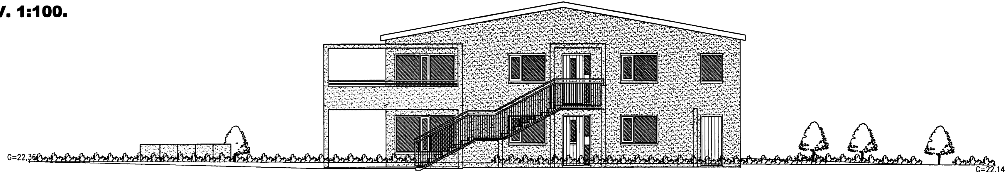
ÚTLIT AUSTUR MKV. 1:100.