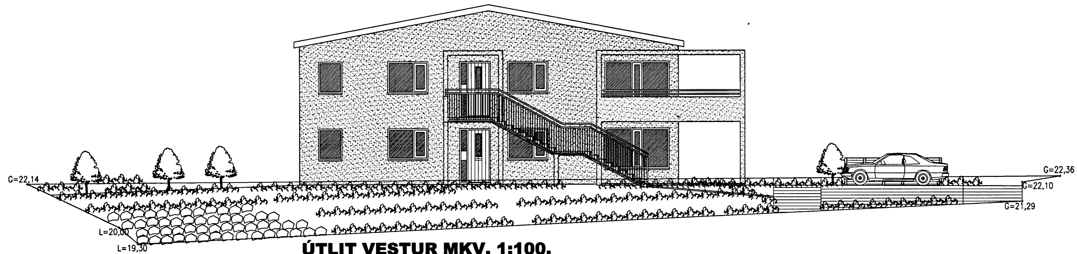
ÚTLIT VESTUR MKV. 1:100.