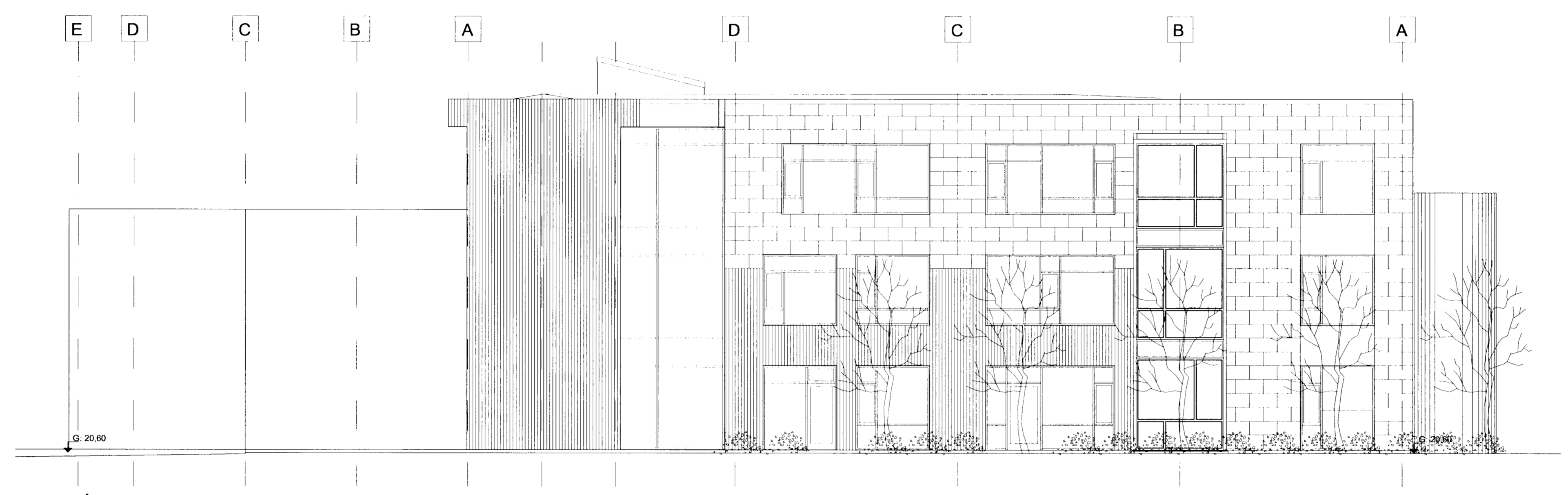
ÚTLIT TIL SUÐURS