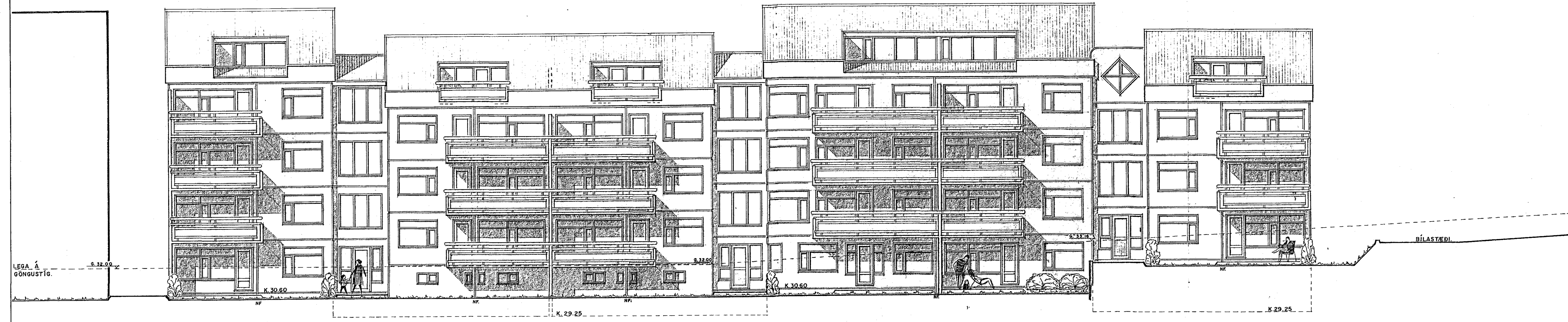
SUÐ - AUSTURHLIÐ. 1:100