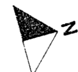
AFSTÖÐUMYND M 1:500