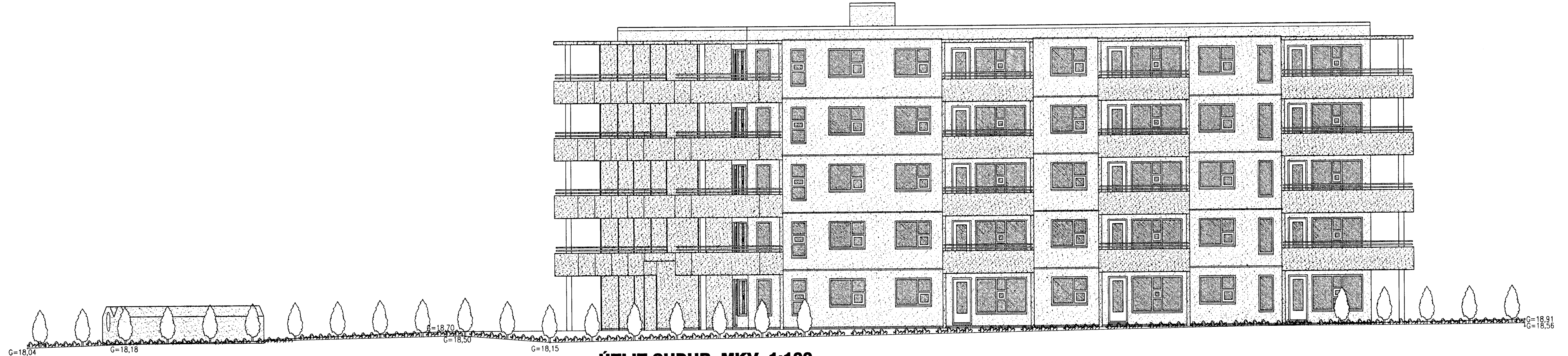
ÚTLIT SUÐUR MKV. 1:100.