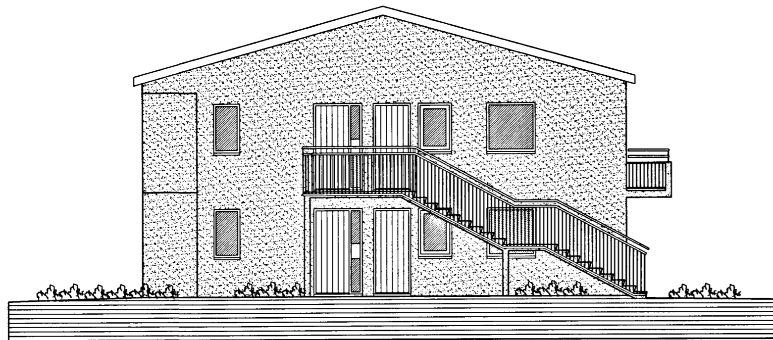
ÚTLIT VESTUR MKV. 1:100.