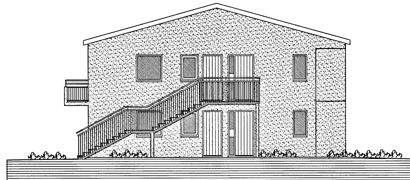
ÚTLIT AUSTUR MKV. 1:100.

pr.pr. Harðviðarhóls enif. Kt. 520298-2079