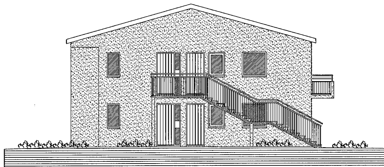
ÚTLIT VESTUR MKV. 1:100.