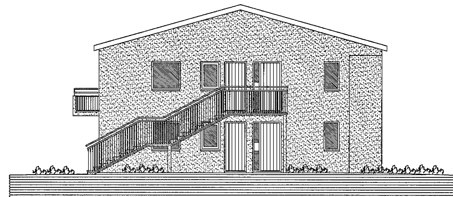
ÚTLIT AUSTUR MKV. 1:100.