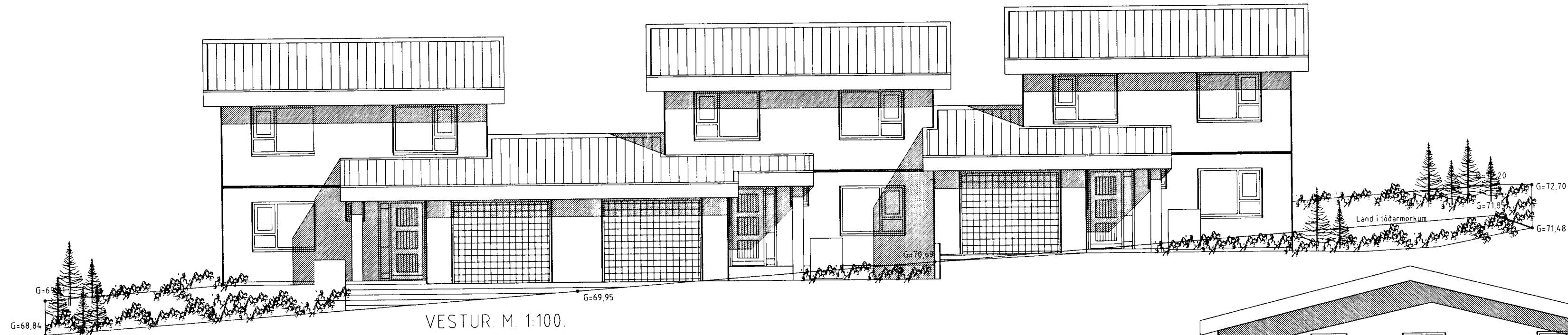
VESTUR. M. 1:100.