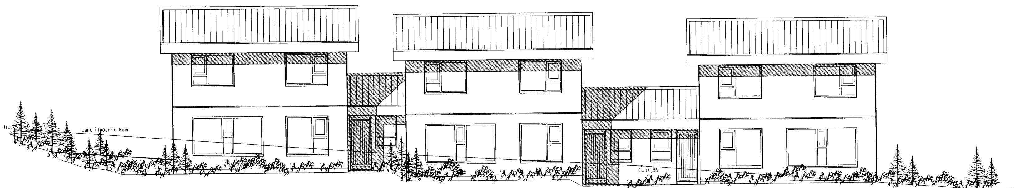
AUSTUR. M. 1:100.

Varðandi frekari málsetningar, sjá sérteikningar aðalhönnuðar í mkv. 150. Séruppdrættir skulu unnir þegar aðaluppdrættir hafa verið samþykktir af byggingaryfirvöldum.