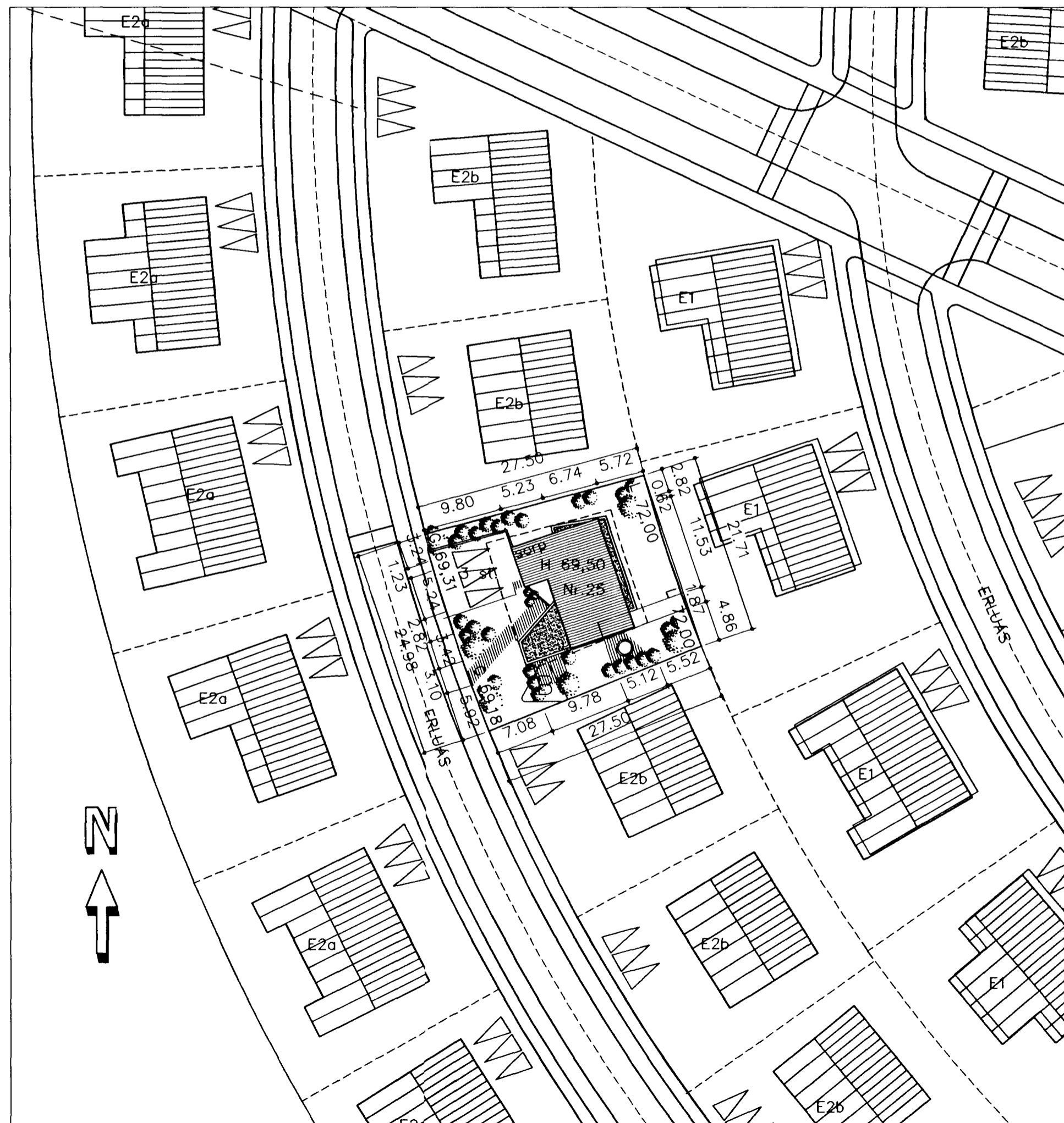
AFSTÖÐUMYND Í Mkv. 1:500

Klæðningar Innanhúss eru a.m.k. í flokki 2.