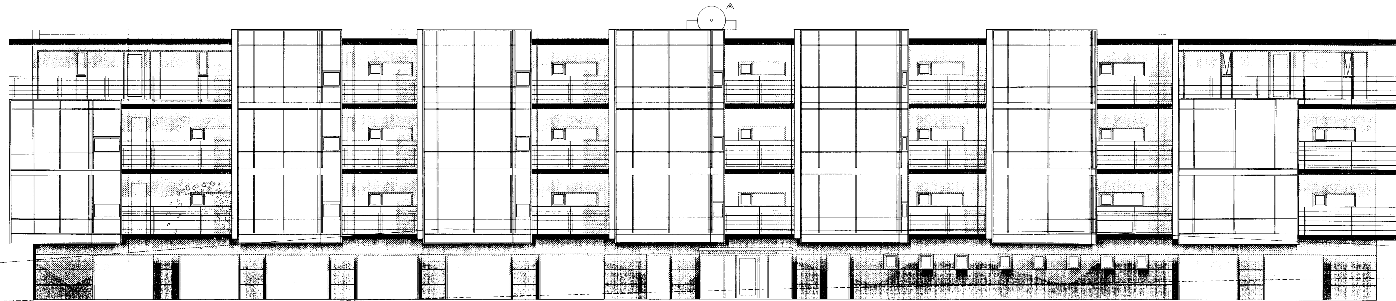
ÚTLIT VESTUR MKV 1:100

Samþykkt þann 16 JUNÍ 2003 Byggingafulltrúinn í Hafnarfirði F.h. Sigurbjartur Halldórsson