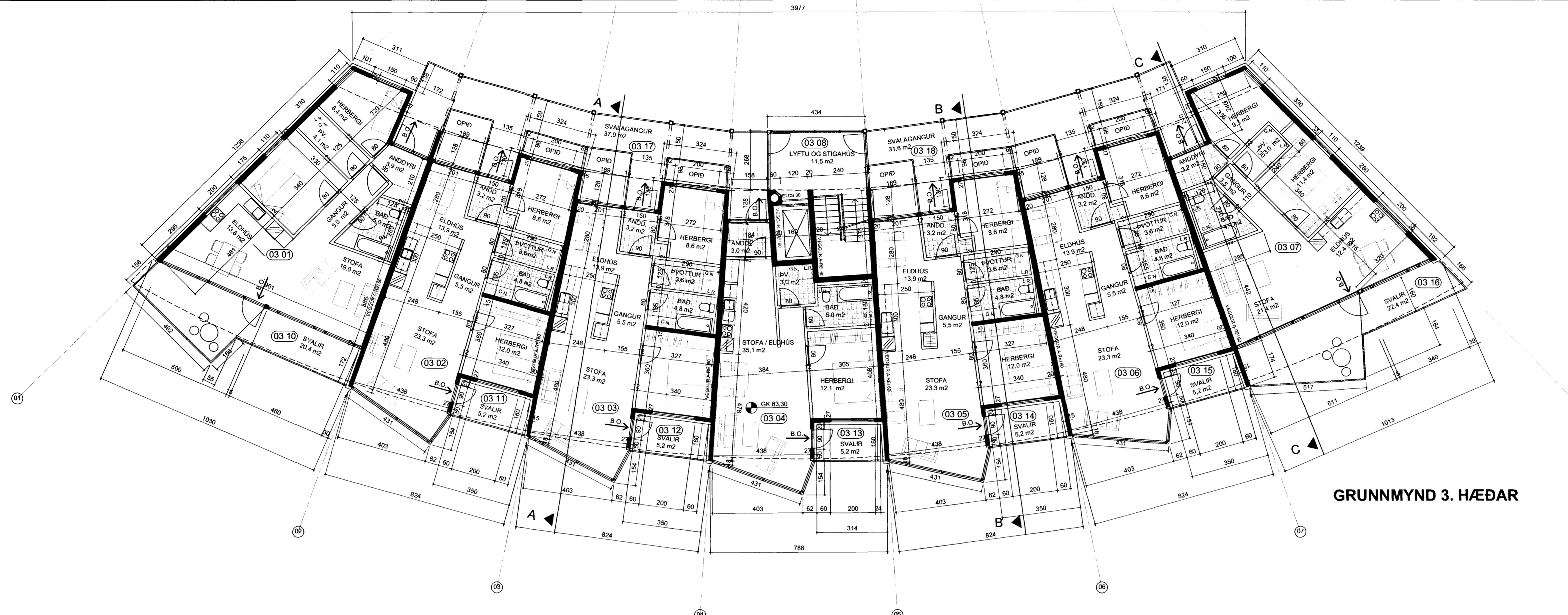
GRUNNMYND 3. HÆÐAR