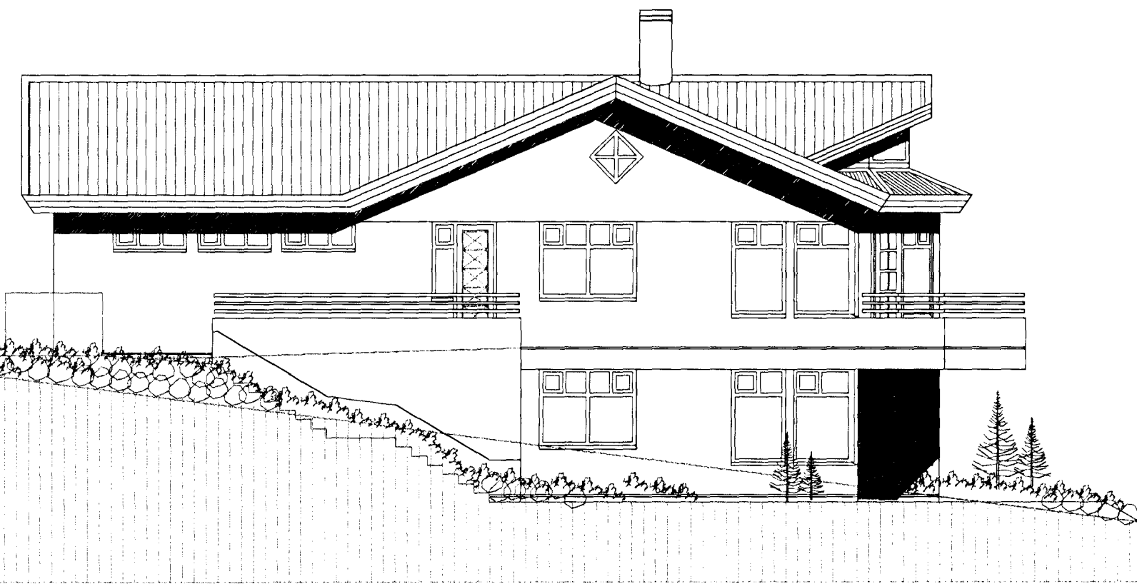
ÚTLIT NORÐUR MKV. 1:100.