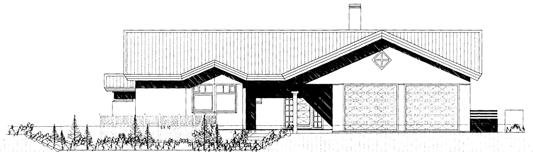
ÚTLIT AUSTUR MKV. 1:100.