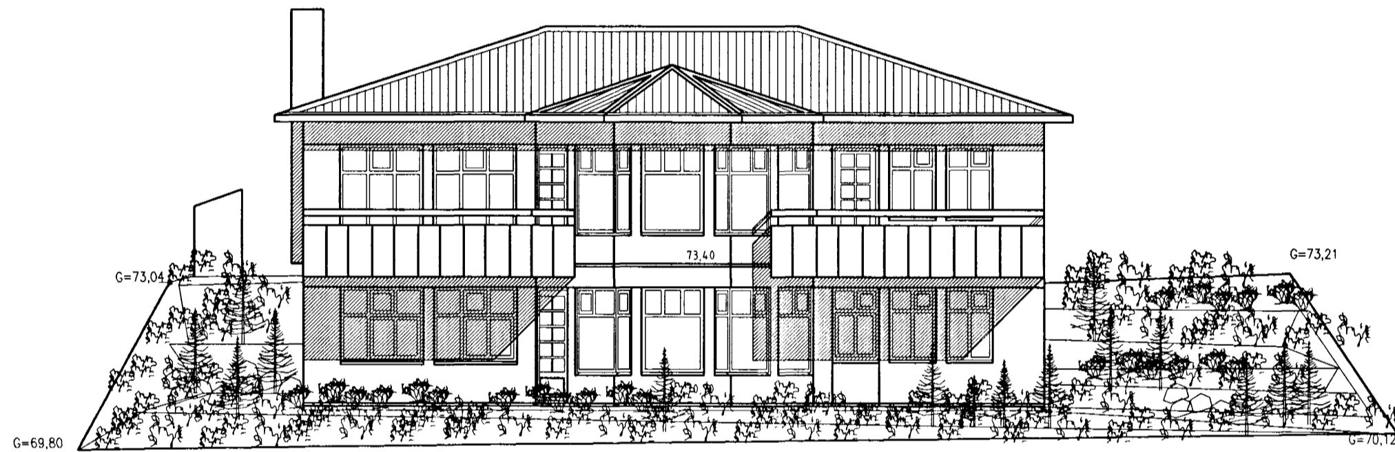
NORÐVESTUR. Mkv. 1 : 100.