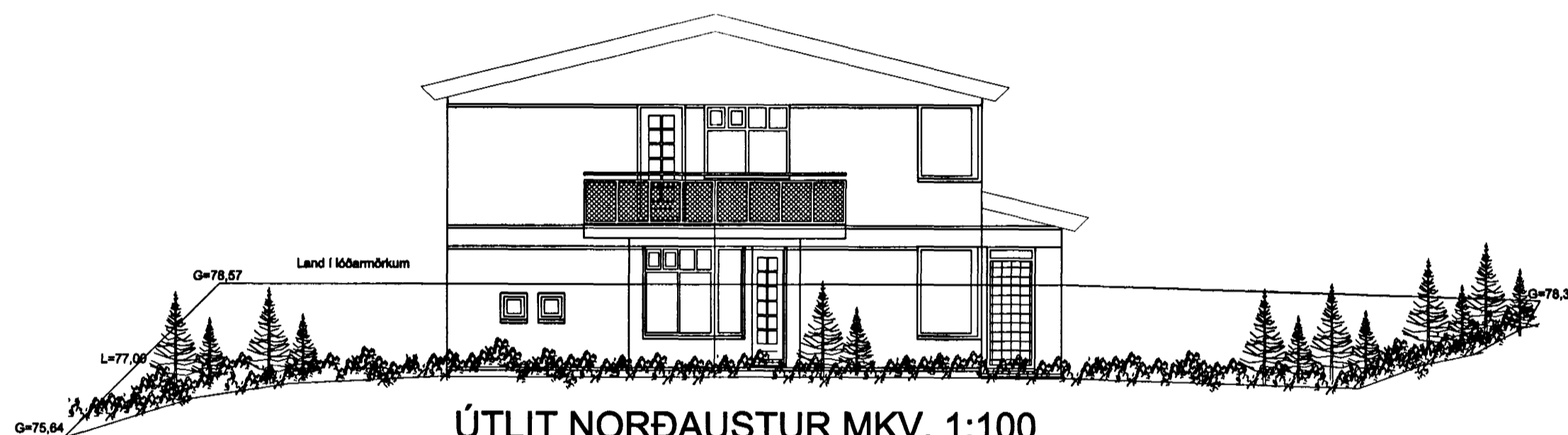
ÚTLIT NORÐAUSTUR MKV. 1:100.