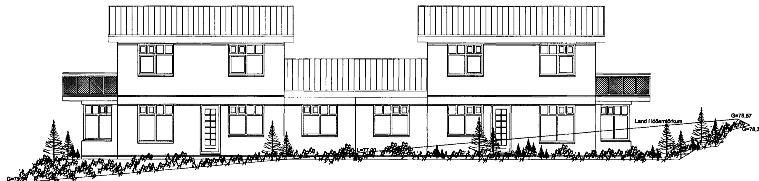
ÚTLIT SUÐAUSTUR MKV. 1:100.