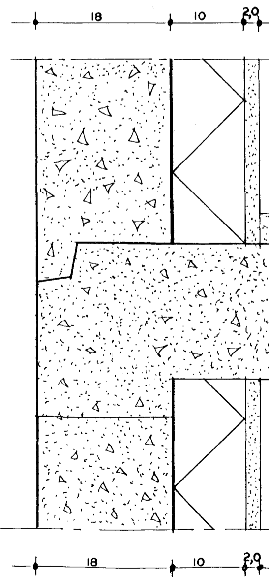
HLUTAMYND NR. 3. MKV. 1:5.

Byggingafræðingur Afgreitt þann 23 FEB. 1999 Sigurbjartur Halldórsson