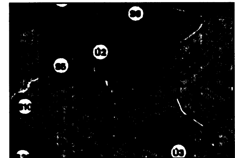
Staðsetning í bæjarlandi

Enn er vakin athygli bæjaryfirvalda á þeim göngustíg, sem lóðarstækkunin tekur mið af, göngustígs"bútur" sem endar niður á Hraunbrún. Ökumaður úr vesturátt sér ekki þann sem kemur frá stígnum fyrir en viðkomandi er komin út á götu. Því er lagt til, af öryggisástæðum að þessi göngustígsbútur verði fjarlægður, þar sem eiginlegur göngustígur Garðavegs er hinumegin og endar á gangbraut yfir Hraunbrún. Lóðarhomið með grenitjánnum er áfram hluti af bæjarlandi.