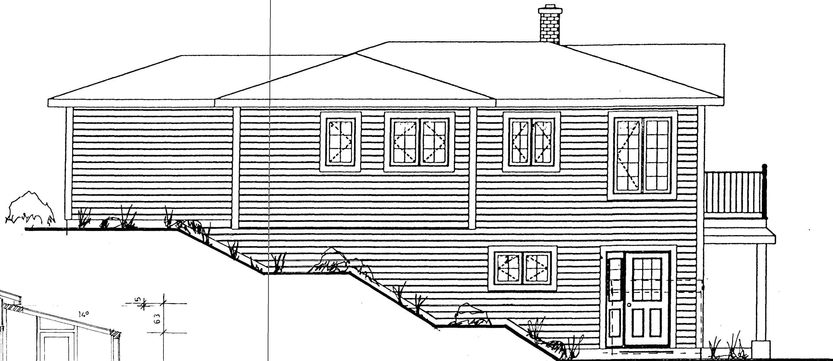
norð vestur hlið