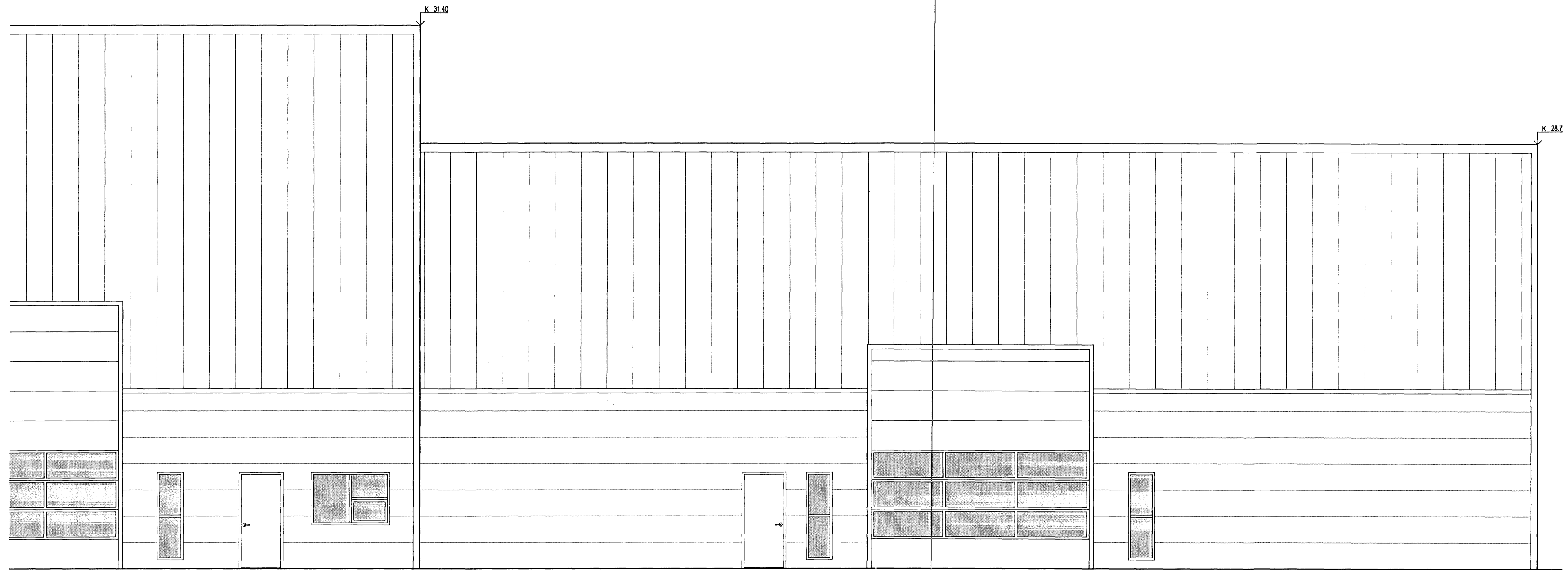
1 ÚTLIT 1:50 ÚTLIT SUBUR (hluti)