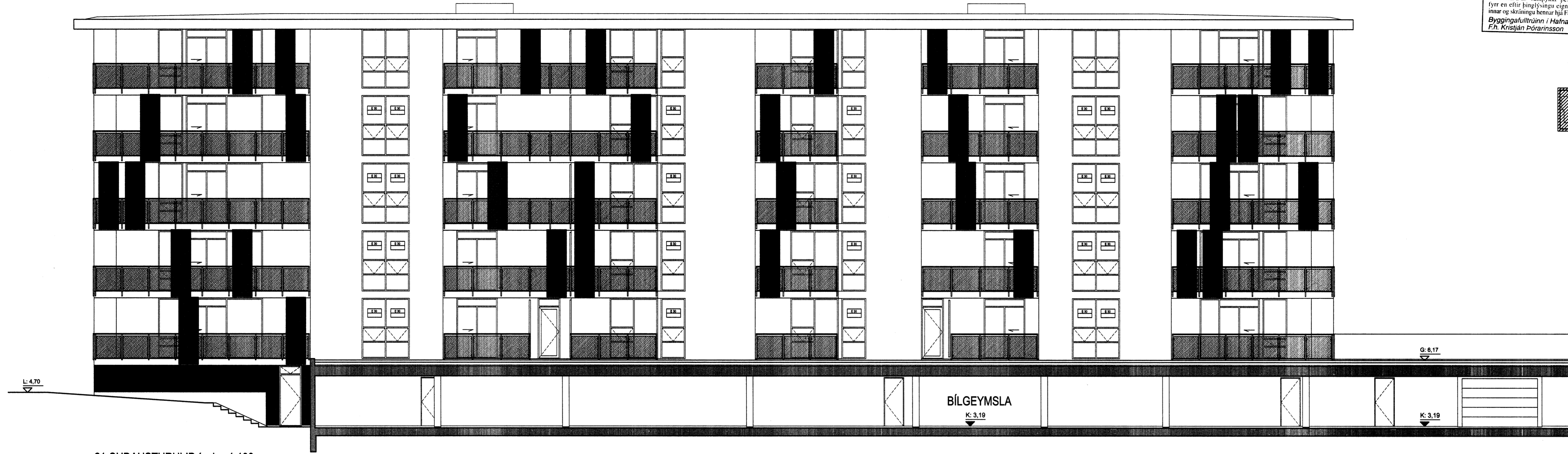
21-SUÐAUSTURHLIÐ í mkv. 1:100